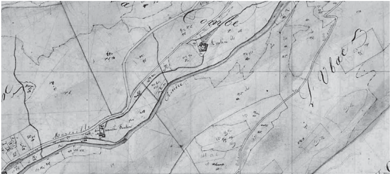
Fig. 7: Extrait du cadastre napoléonien, les anciens moulins sur le cours de l'Aiguebrun.