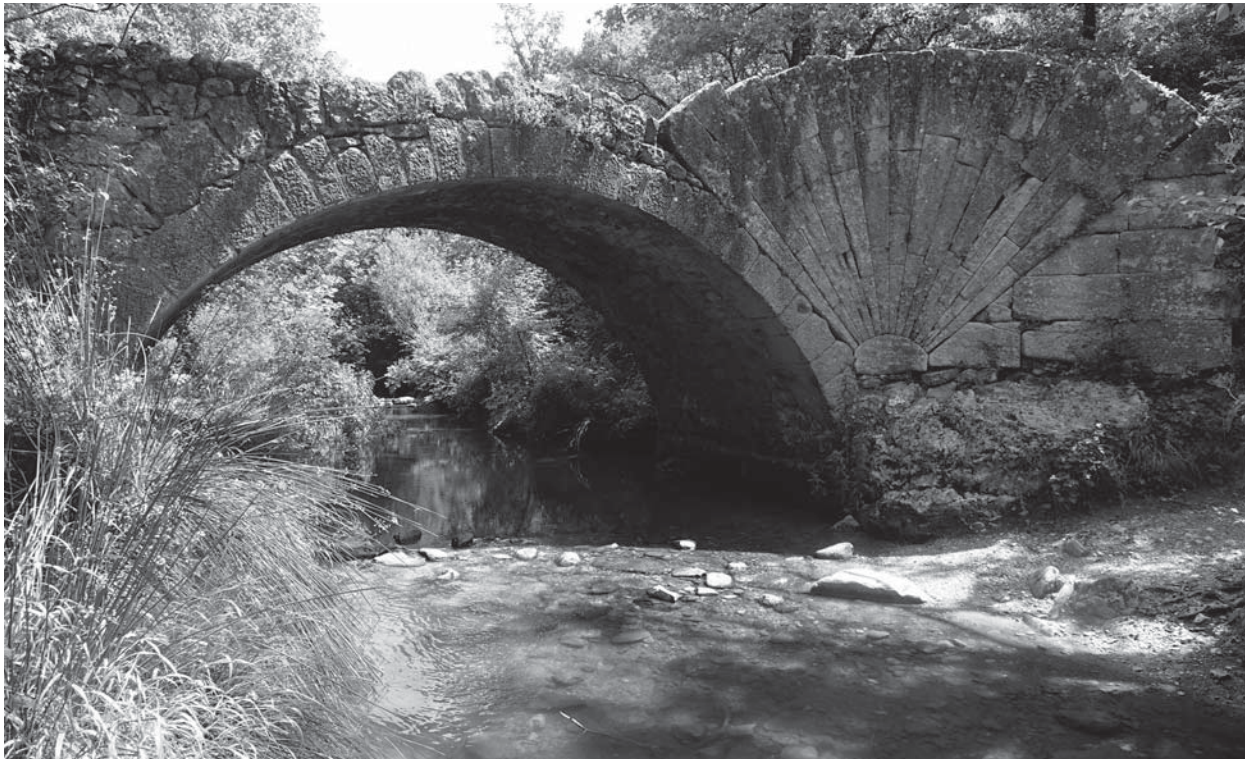
Fig. 2 : l'Aiguebrun au niveau du pont à la coquille.

forêts réservoir de biodiversité. En amont de l'Aiguebrun, de nombreuses prairies bordent le cours d'eau. Ce sont des prairies de fauche naturelles qui fournissaient un fourrage de grande qualité et qui offrent également une biodiversité remarquable.