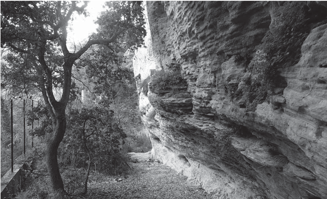
Fig. 3 : l'entrée obturée de la grotte des Peyrards.