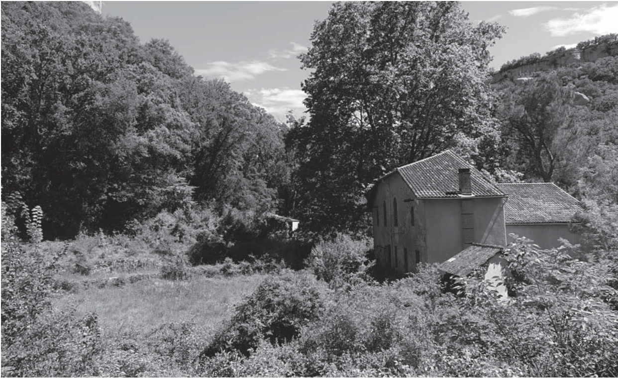
Fig. 8 : les bâtiments abandonnés à la Tuilière.

De cette façon, la multitude des murs en pierre sèche, des terrasses, serait le résultat probable de cet élan qui anima le vallon entre les XVI e et XVIII e siècle, avant une baisse d'activité au XIX e siècle.