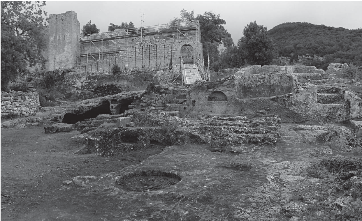
Fig. 6 : le Fort : le bourg et premières défenses.

Malgré les réserves et imprécisions, il est indéniable que le site de Saint-Germain constitue un point central pour illustrer la question de la présence des hommes dans le vallon. À l'appui des témoignages, et grâce à la découverte de l'autel tabulaire daté du haut Moyen Âge et conservé dans l'église paroissiale de Buoux, le site apparaît comme un élément clé. Véritable point d'ancrage de la société proto médiévale, calé entre l'Antiquité et le Moyen Âge, il permet de saisir le cadre qui s'instaure et aboutira à terme à l'implantation, durant le X e siècle, des règles de la société médiévale au temps de la féodalité. Et dès avant cette période, on assiste à la création de foyers organisés à partir de lieux de culte, comme il est pressenti pour le site de Saint-Symphorien.