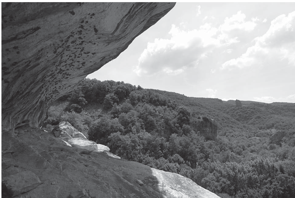
Fig. 1 : le vallon vu depuis l'une des grottes creusées dans les falaises.