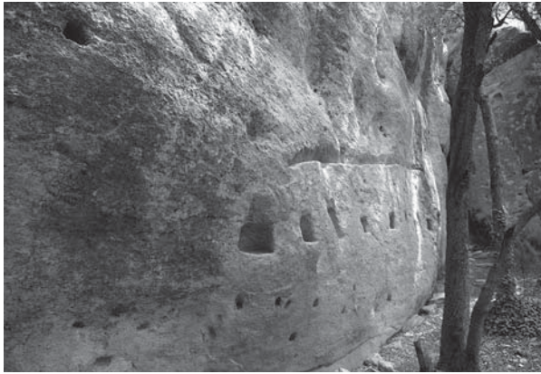
Fig. 4 : les abris semi troglodytiques à Moulin clos.