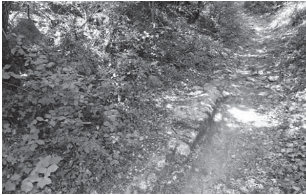
Fig. 9 : ornière sur l'ancienne route de Marseille dans le quartier de la Tour.

jeu résulte des recherches effectuées ces dernières années au fort. Elles révèlent, en effet, des productions céramiques originales dont la provenance échappe pour l'heure. Composés essentiellement de productions culinaires, particulièrement abondantes pour les XVI e et XVII e siècles, les lots offrent également des faïences décorées d'époque pontificale XIV e dont la texture des pâtes semble désigner un centre de production encore inconnu. De là à imaginer une origine locale et une industrie spécifiquement buolisienne, voici un pas que nous ne franchirons pas encore et qui nécessitera la poursuite des analyses et études conduites sur le terrain et en laboratoire.