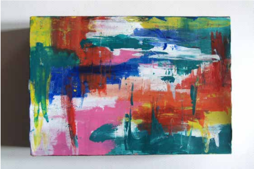
Figura 2 · Trabalho de aluna B (1.º ano, do Curso de Licenciatura em Educação Básica, do Ano Letivo 2017/2018).