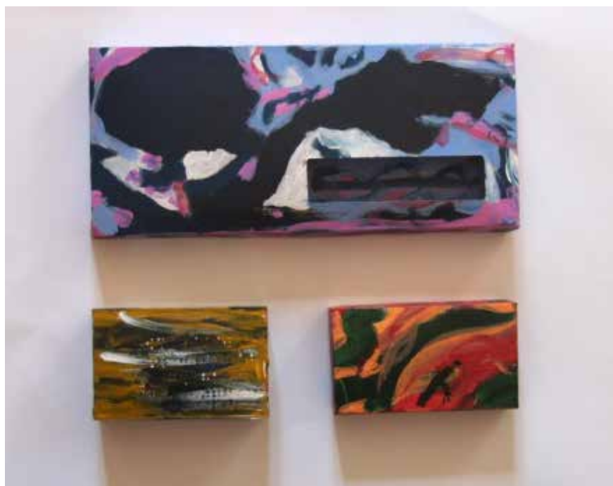
Figura 1 - Trabalho de aluna A (1.º ano do Curso de Licenciatura em Educação Básica, do Ano Letivo 2017/2018).