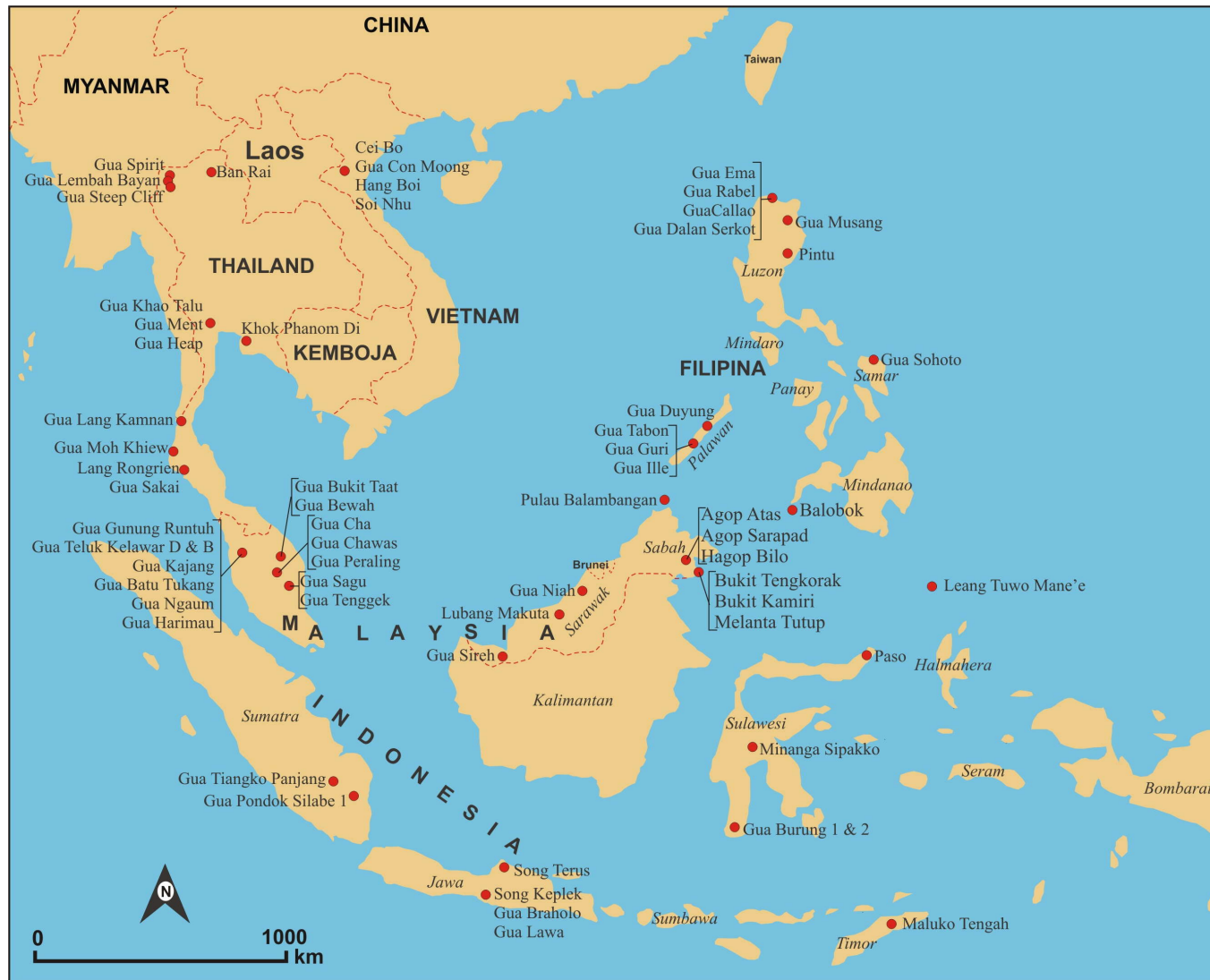
Rajah 2.1: Taburan tapak-tapak Pleistosen Akhir dan Holosen di Asia Tenggara