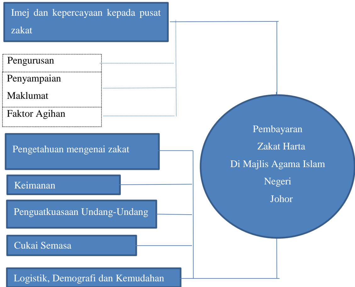
Rajah 1.2: Kerangka Konseptual Kajian