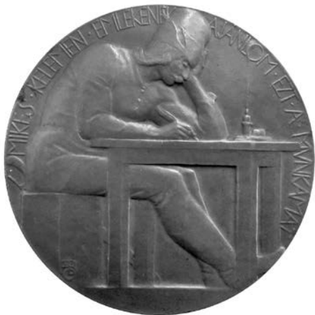
2. Beck Ödön Fülöp: Mikes Kelemen (1907)

Az 1879-es közlés nyomán széles körben ismertté vált portré hagyományától eltérő ikonográfiát követnek Beck Ödön Fülöpnek a kardos, kucsmás Mikest asztalnál ülve profilban ábrázoló, 1907-ben készült érmei. 14 Mikes alakját Beck két érmen is megformálta: mindegyik a gyertyafénynél munkája fölé hajoló, lúdtollal író Mikes