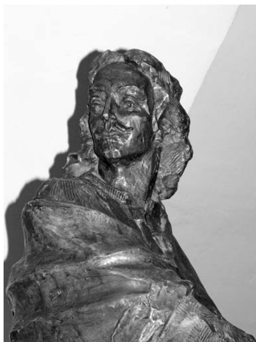
8. Veres Alpár: Mikos Kelemen (részlet). Sepsiszentgyörgy

új kompozíciót teremt. A szoborcsoport kifejezi a száműzetést, a raboskodást és a szabadság utáni vágyat.