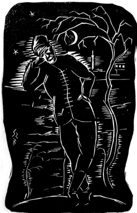
4. Gy. Szabó Béla: Mikes Kelemen (1934)

Az illusztráció műfajban Gy. Szabó Béla készítette az első Mikes-sorozatot. A fametszetsorozat Komáromi János Zágon felé (Regény Rodostórról) című művéhez készült, amely a Reményik Sándor szerkesztette Pásztortűzben jelent meg folytatásokban. 39 A Bercsényi halálát és Zsuzsi elutazását elbeszélő részhez készített két fametszet közül az első az éjjel, növekvő hold mellett, szabadban elmélkedő, fejét jobb tenyerébe hajtó Mikest mutatja egész alakban ( 4. kép ). 40 A második a nyugtalan lelkű, búsuló, beteljesületlen szerelemtől és honvágytól szenvedő Mikest ábrázolja. 41 Mindkét metszet középkorú, csizmás, kucsmás székely képében ábrázolja Mikest. A táji elemek – így az első lapon az alak fölé boruló fa, a másodikon az alacsony horizontú, dombos táji háttér előtt monumentálisan kiemelkedő alakot közreévő magányos fák – egyaránt az író belső világára utalnak. Míg az elsőn a nagy, fekete felületekbe vékony fehér vonalakkal megrajzolt kompozíció a csend és a mozdulatlanág benyomását kelti, a másodikon a fekete felületbe sűrűn metsződő fehér vonások az alak szorongással és feszültségekkel teli lelkiállapotát tükrözik. 42 A regény utolsó része 1758-ban játszódik, amint Paksy Erzsébet vigasztalja a majdnem vak író, majd a látását visszanyerő Mikes megírja utolsó levelét „Édes Nénjének”. E fejezet illusztrációja szolgáljával, Horváth Istvánnal hátulról ábrázolja az öreg Mikest, amint hajlott háttal, botra támaszkodva bandukolnak a rodostói tengerparton. 43