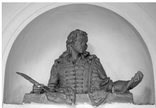
6. Vágó Gábor: Mikes Kelemen (1932). Kolozsvár

Búza Barna Mikes-mellszobrán a hosszú hajú, ráncos homlokú, hosszú, vékony bajszú Mikes egyenesen előre néz, mellén lánccal összefogott mentét visel. A szobrot két helyszínen is felállították az 1980-as években: 55 1982-ben a battonyai Mikes Kelemen Gimnázium fennállásának 35. évfordulóján a Mikes Kelemen Gimnázium utcai előterében, 56 1988. május 28-án a berettyóújfalui Bajcsy Zsilinszky lakótelepen. 57 Míg az első változat pirogránitból készült, a második ún. pirobronzból, mely a művész találmánya. Ennek lényege, hogy a pécsi pirogránitba 200 mm vastag bronzot égetett 1200 fokon, ezáltal az anyag igen tartóssá vált. 58