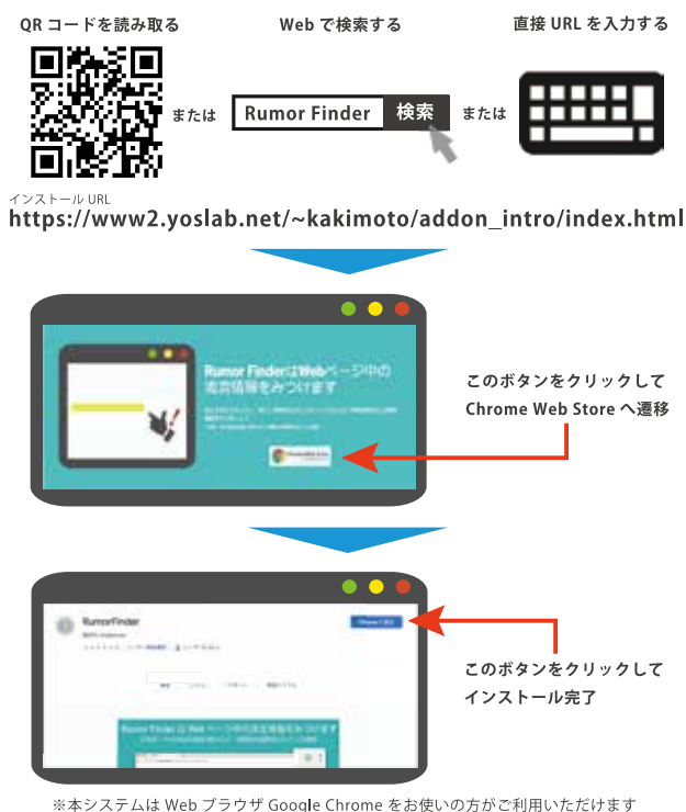
付録図-1 システムのインストール手順

http://www2.yoslab.net/~kakimoto/addon_intro/index.html また、インストール手順については付録図-1に示す。