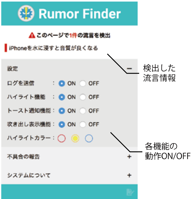
図-4 カスタマイズ機能

う。なお、2018年11月19日時点でのシステムのユーザ数は59人であり、期間中に利用ログの送信を一度でも行ったユーザ数は47人であった。ただし、利用ログは端末ごとに取得しているため、同一ユーザによる複数端末におけるシステムの利用および複数ユーザによる同一端末におけるシステムの利用が考えられる。本稿では、利用ログを取得した端末1台を1ユーザとみなす。また、利用ログの送信を行った47人のユーザのうち、11人のユーザは、閲覧ページ数の合計が10件未満であった。本システムは、一度インストールされると、ユーザに対して流言情報の検出が自動通知される仕組みを取っており、システムからの通知に対し、確認行動を取るかどうかはユーザの自由である。ただし、本システムが流言の拡散防止に貢献するためには、インストール直後に起こりがちな一過性の利用ではなく、積極的な確認行動をユーザが継続できるようにすることが求められる。一過性の利用のみで、その後利用が見られないユーザについては、一般公開によりシステムをダウンロードしたユーザであるため、なぜ利用しないのか等を直接調査することが難しい。一方、