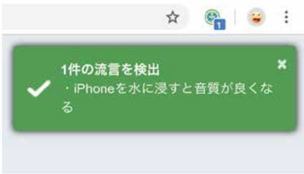
図-3 トースト通知機能