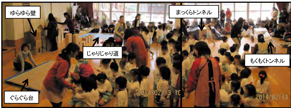
図-2 防災保育の一風景. 前方に園児と保育者, 後方に保護者 (2枚の写真を接合している)