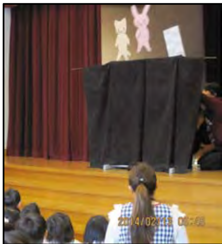
図-3 ペーパーサートによる劇を演じる 和歌山大生と熱心に見る子どもたち