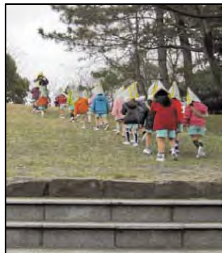
図-4 防災保育終了後の園外(高台)への 2次避難訓練の様子

◎地震防災保育(教室)についての 保護者 アンケート Q1. お子様の年齢とクラスをお教え下さい。 Q2. これまでに地震や風水害などのもしもの時について、ご家族で話し合われたことがありますか？ Q3. 家に帰ってから、園で行った地震防災保育について、話をされましたか？話をされた方は、どのようなお話をされましたか？内容をお教えてください。 Q4. 園での防災保育をもっとやった方が良いと思いますか？ Q5. 防災保育を行う際には、家庭と園で連携して行う機会が必要だと思いますか？ Q6. 今回の地震防災教室(保育)について、ご意見がありましたらご記入ください。 Q7. その他、ご感想やお気付きの点をご記入下さい。 (※2, 3, 4, 5は, Yes or Noの設問)