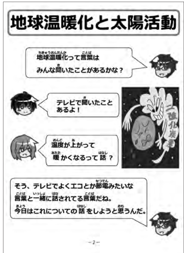
図2 (左)中間発表時の冊子の表紙。(右)中間発表時の冊子の中身。

んだ。その小学校には本授業への協力をお願いするため、アンケート配布の1ヶ月前から受講生とともに何度も小学校に足を運び綿密な打ち合わせを行った。