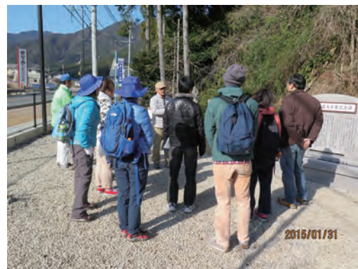
写真-5 紀伊半島大水害慰霊碑の前に土石流による被害についてガイドの説明に耳を傾ける参加者