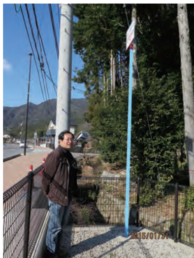
写真-6 氾濫水位を示す標柱とその高さに驚く参加者

また、時間の関係上昼食を食べてからの行程であったことから、途中で休憩する機会がなくなってしまった。トイレ休憩をはさむことで対応したが、当日の気候条件も悪かったこともあり、参加者への負担となっていた。ジオサイトでの見学が連続するのではなく、実際に体験できる場所や参加者が飲食できる機会をはさむなど、ツアー行程内でのメリハリも重要だということが再認識された。