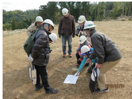
写真-4 金山谷で和歌山大学の研究成果をもとに紀伊半島における土砂災害の危険性について解説するガイド