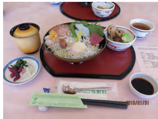
写真-3 休暇村南紀勝浦が提供するジオ井