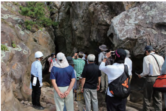
写真-2 鈴島でガイドから説明をうける参加者