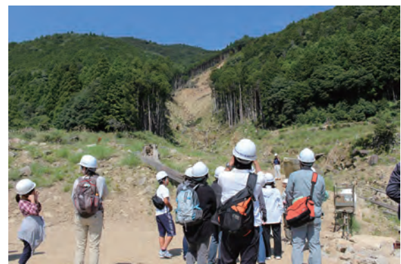
写真-1 金山谷でガイドから説明をうける参加者

昭和19年12月7日の東南海地震による津波被害を現在に伝える大津浪記念之碑を前に、昭和の南海・東南海地震による津波について考えた。