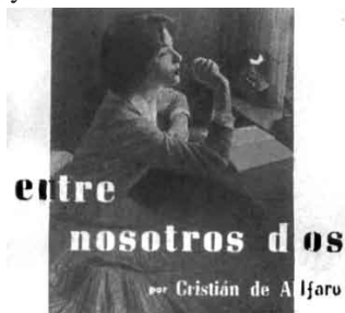
"Damas y Damitas" 1968

En el siglo XVIII este motivo sigue vinculado a la reflexión íntima relativa a las cuestiones sentimentales. A finales del siglo XVII los ámbitos para la intimidad constituyen una novedad; de ahí la evocación en estas pinturas a la escritura como representación de los placeres que proporciona esta nue-