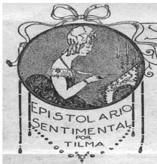
"Para Ti" 1926