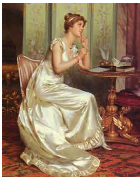
"La respuesta" Vittorio Reggianini (1858)

va vida en el ámbito privado, cuando la mujer se sustrae de las tareas hogareñas y los espacios de la comunidad familiar.