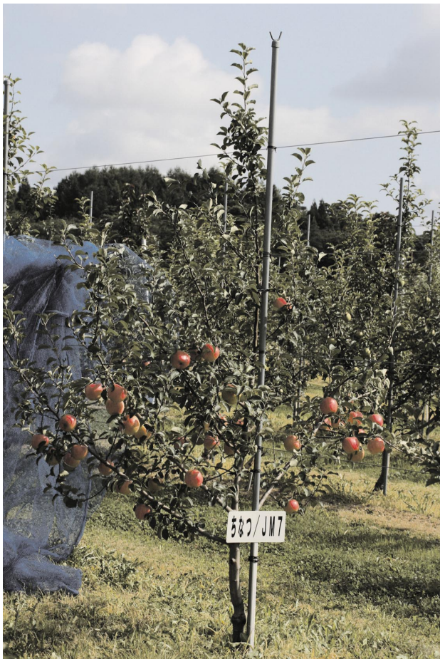
Fig. 2 Bearing tree of ‘Chinatsu’ on JM 7 (5-years-old).

300 g程度の果実が生産できる（データ省略）。果皮色は濃赤色（日本園芸植物標準色票値0409）で、縞が入るが、着色の程度はやや少ない。果形は円形で、果梗が短い。王冠の程度は「弱」、がくの開閉は「中」、がくあへの深さは「中」、広さは「広」、こうあへの深さは「浅」、広さは「やや狭」である。果点の大きさは「やや大」、密度は「やや低」、果皮の脂質は「中」、粗滑の程度は「滑」である。果面さびの発生は少ないが、年により、こうあ部にさびが目立つ場合があり、特に側果には発生しやすい傾向がある。