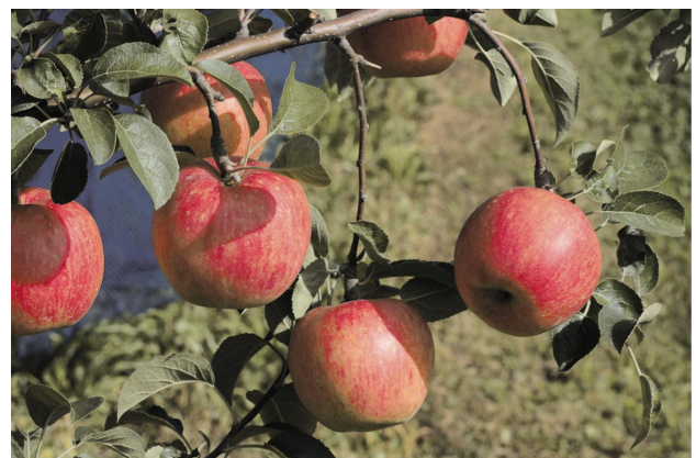
Fig. 3 Fruit of ‘Chinatsu’

果心の形は平円形で、大きさは「小」である。種子の形は倒卵形で、大きさは「中」である。果肉の色は白色で、切り口の褐変は少ない。果肉の硬さは14.1 lbs