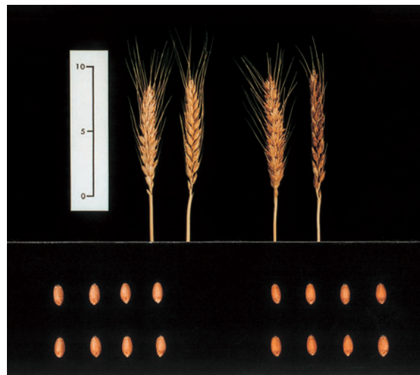
写真2 ニシノカオリの穂と粒 左：ニシノカオリ 右：農林61号