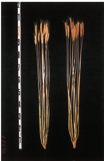
写真1 ニシノカオリの株 左：ニシノカオリ 右：農林61号