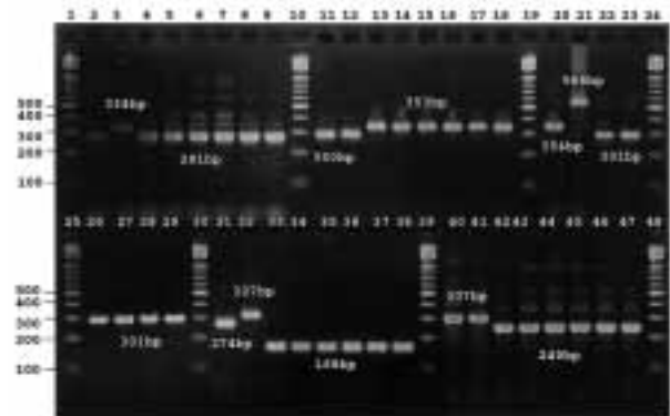
図1 PCR増幅産物のサイズの測定例。PCR反応終了後1 \mu lを2.5%アガロースゲル電気泳動にて解析した。100bpラダーのマーカの泳動像と比較して、PCR増幅産物のサイズを推定した。レーン1, 10, 19, 24, 25, 30, 39, 48:100bpラダーマーカー。レーン2~9, 11~18, 20~23, 26~29, 31~38, 40~47:それぞれプライマーセットMATR-1, MATR-2, MATR-3, MATR-3, MATR-4, MATR-5にてターゲットDNAを増幅した。テンプレートDNAは各プライマーセットにおいてレーン番号の小さいほうから鳥型結核菌参照株A, 同B, 鳥型結核菌野外分離株1, 同2, 同3, 同4, 同5, 鳥型結核菌参照株Cの順である。得られたサイズから換算表(表3)にて縦列反復配列の反復数を求める。さらにこの値から各株のアリルプロファイルを求める(図2)。