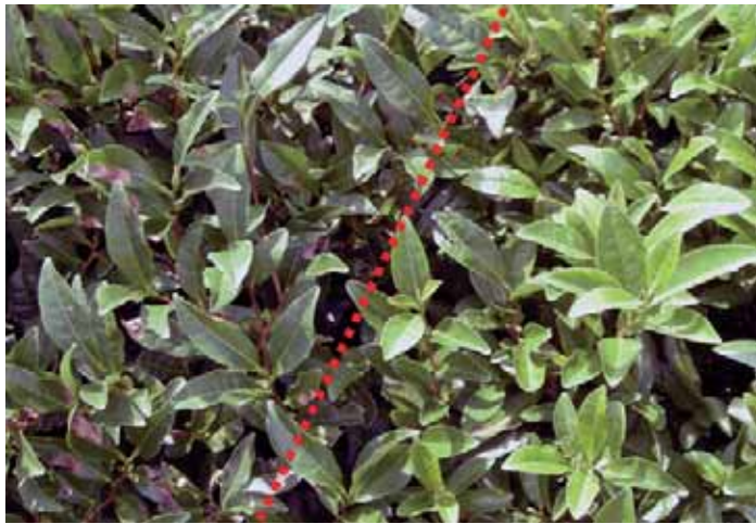
図-7 秋芽生育停止期におけるチャ炭疽病発病の品種間差異（育成地）

赤破線の左側は罹病性の‘さやまかおり’，右側は‘さえあかり’。2008年10月1日に撮影した。部分的に茶色に変色した茶葉が炭疽病罹病葉。