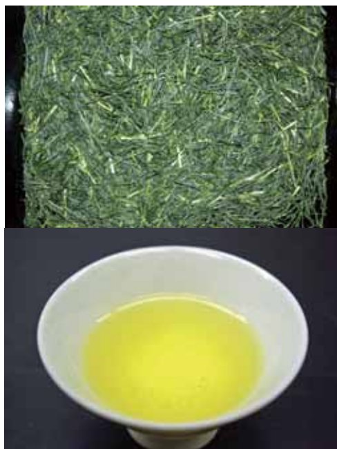
図-9 育成地における‘さえあかり’一番茶荒茶の外観と水色