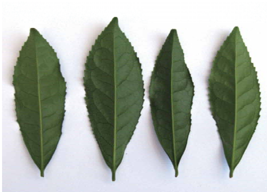
図-6 成葉形態の品種間差異

左から‘やぶきた’，‘Z1’，‘さえみどり’，‘さえあかり’．育成場所の一番茶徒長枝から採集し，2010年6月16日に撮影した．各品種の葉長は10cm程度．