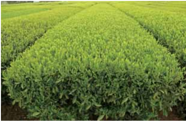
図-3 ‘さえあかり’の一番茶期の園相 2009年4月17日鹿児島県農業開発総合センター茶業部圃場（南九州市）にて撮影。