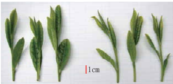
図-5 一番茶摘採期の‘さえあかり’（左）と ‘やぶきた’（右）の新芽 新葉は鹿児島県農業開発総合センター茶業部圃場（南九州市）において、摘採期である2009年4月17日に撮影した。‘やぶきた’は撮影3日後の4月20日に摘採された。

‘さえあかり’の挿し木平均生存率は85.4%，5段階評価における挿し木均整度は3.7，生育の良否は3.8であった（表-7）。定植2年目の活着率，樹高，生育の良否の全国平均値は‘やぶきた’と同等であり，株張りは‘ゆたかみどり’と同等であった。試験最終年度の樹高と株