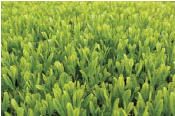
図-4 ‘さえあかり’の一番茶新芽 2009年4月17日鹿児島県農業開発総合センター茶業部圃場（南九州市）にて撮影。