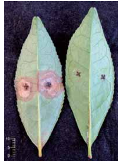
図-8 チャ輪斑病接種検定における病斑拡大の品種間差異（育成地）

赤破線の左側は罹病性の‘さやまかおり’，右側は‘さえあかり’。2008年10月1日に撮影した。部分的に茶色に変色した茶葉が炭疽病罹病葉。