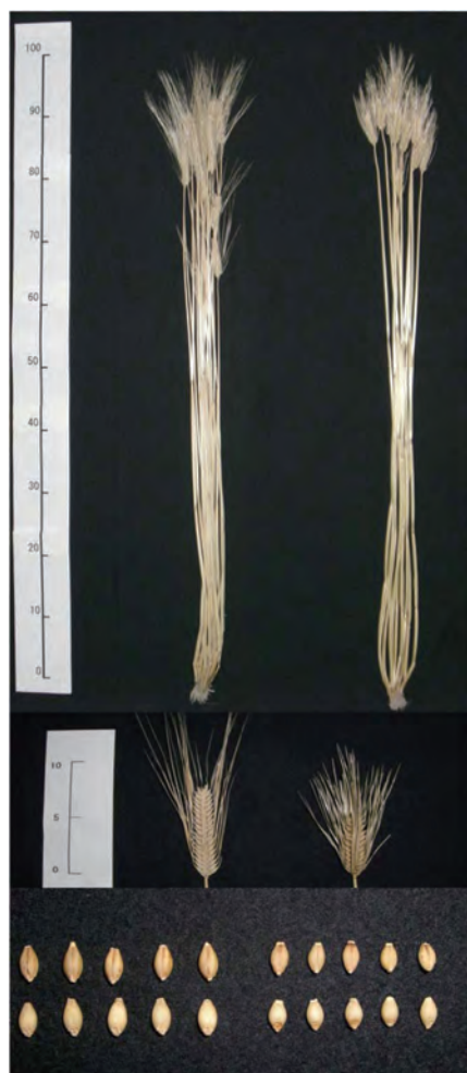
「ユメサキボシ」 「イチバンボシ」