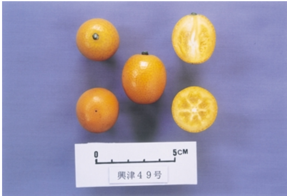
Fig. 2. Fruit of 'Puchimaru'.