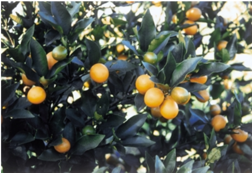
Fig. 3. Fruiting branch of 'Puchimaru'.