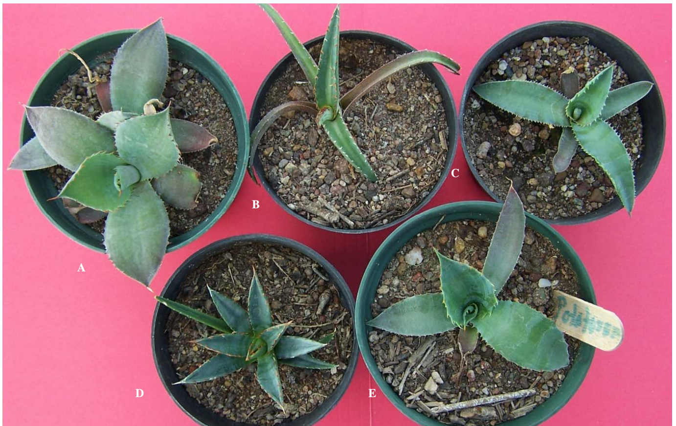
Figura 2. Plantas generadas in vitro creciendo en invernadero, a cuatro meses de su transferencia a suelo. A) Agave cupreata ; B) A. difformis ; C) A. karwinskii ; D) A. obscura ; y E) A. potatorum .