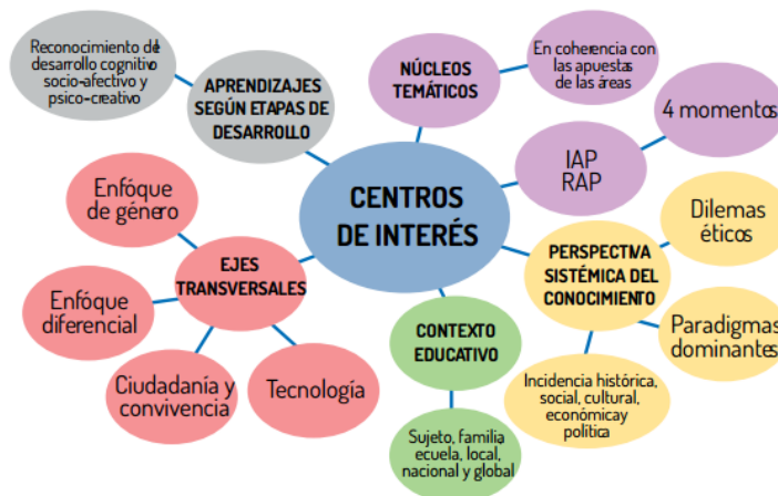
Figura 3: Aspectos que se deben tener en cuenta al planear, construir e implementar un centro de interés.