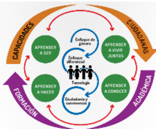
Figura 2. Currículo para la excelencia académica y la formación integral: aspectos esenciales, pilares y ejes transversales para el buen vivir