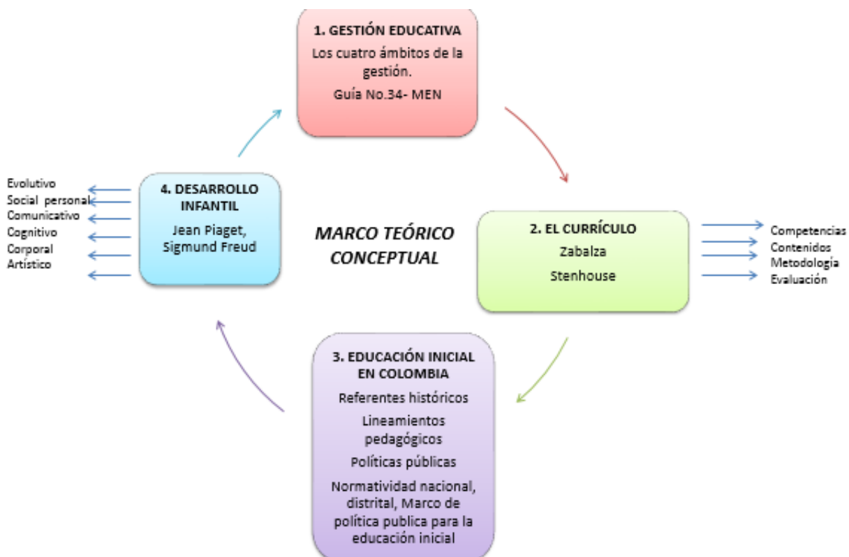
Grafico No. 2 Síntesis marco teórico conceptual

lo cual da sustento legal y fortalece la importancia de esta investigación. El siguiente capítulo, menciona cada una de las dimensiones del desarrollo infantil desde las cuales se abordará la propuesta de plan de estudios.