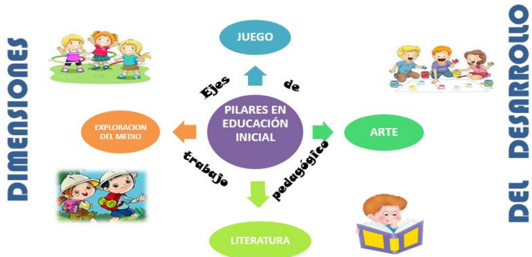
Grafica No. 3 Pilares en la educación inicial