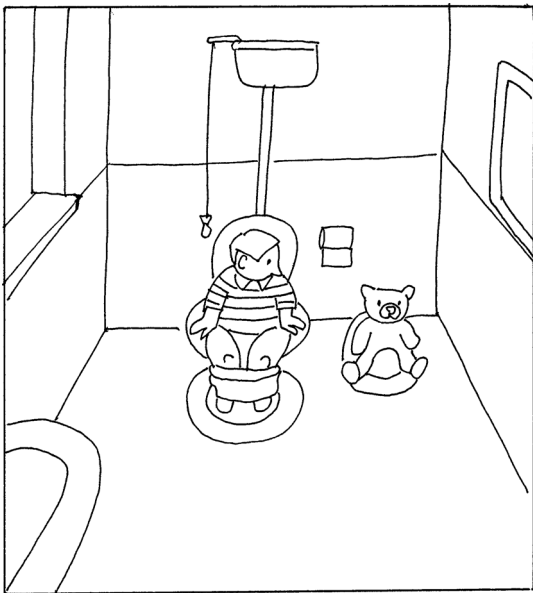
図3-1 男の子と日曜日の構図 (絵本の構図に基づき石川作成)

図3-1では、人間の世界で、男の子にとって「日曜日」がどのような存在であったか、図3-2ではクマの世界で、「日曜日」にとって男の子がどんな存在であったかを端的に描いていた。二つの世界は、鏡で映し出されたような生き写しの世界である。この夢により、男の子は、男の子が「日曜日」を大好きなのと同じように、「日曜日」にとっても男の子が、大好きなのだを知る。男の子はこの夢を通して、「日曜日」と自分は、気持ちを一つに出来る別の存在であるという確信を持つことができた。そして、その確信があったからこそ、具体的対象物としての「日曜日」を手放すこともできたのであろう。「日曜日」は常に自分の中に生きるもうひとりの自分でありまた、自分ではないもの、そしてその対象は常に信頼できるものとして内化され、必要があれば自分と他者の関係を読み解く第三項としていつでもイメージの中に姿を現すことが出来るようになったとも解釈できる。