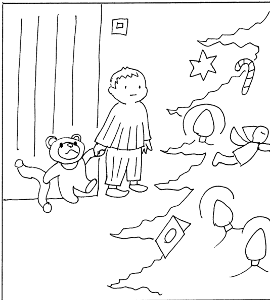
図1 男の子とよるくまの構図 (絵本の構図に基づき石川作成)

て(受け入れて)くれないのではないかという二つの不安を抱えたまま「夢」の世界に入る。男の子の夢の世界の入口をノックし訪ねてきたのが「よるくま」であった。「よるくま」は、クリスマスツリーの飾られた男の子のうちの居間に男の子と一緒に並んで立つ。ここから男の子の夢の世界を旅することになる。この一緒に並んで立つ描写が、本文中にも、そして絵本の裏表紙にもなっている(図1参照)。