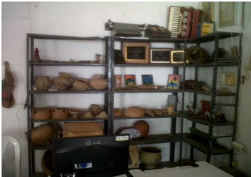
Piezas arqueológicas Casa de la Cultura, San Marcos (Sucre)