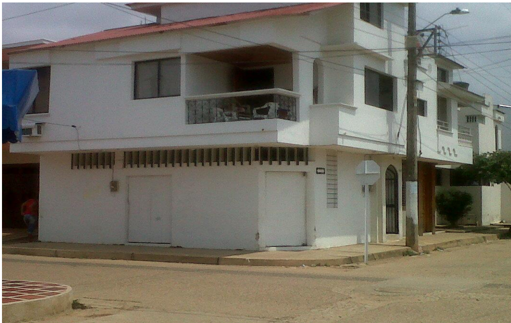
Construcción realizada por Manuel Huertas Vergara en su profesión de Arquitecto