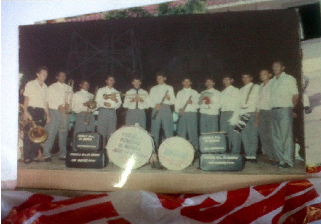
Fotografía Tuna Sanmarquera impulsada por Manuel Huertas Vergara.