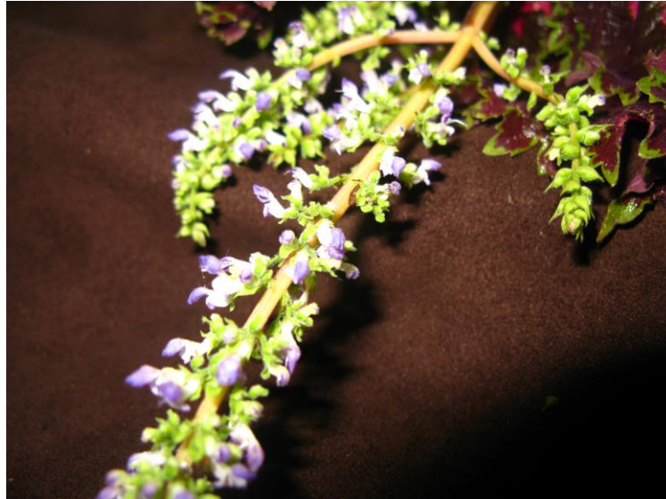
Figura 25. Flores de Plectranthus scutellarioides