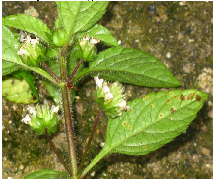
Figura 19. Inflorescencia y tallos de Hyptis atrorubens

Ejemplares examinados. Magdalena: Santa Marta, Hacienda la Victoria Cuenca Media del río Gaira 1200 msnm, 24 sep 2011, N. Chávez 021 (UTMC). Otros ejemplares examinados: Ciénaga, Siberia Sierra Nevada de Santa Marta, Vereda el Congo, 1000 msnm, 15 feb 2009, P. Montoya 232 fl (COL).