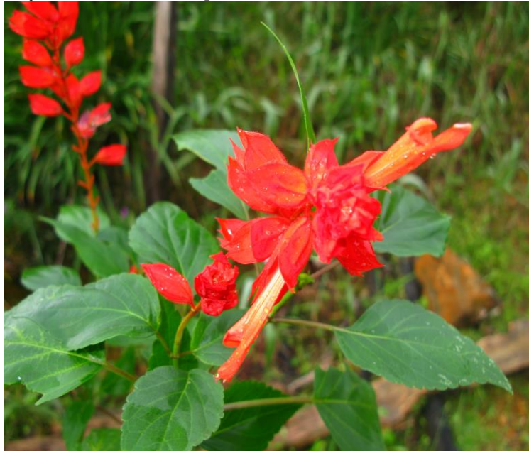
Figura 17. Flores y hábito de Salvia splendens