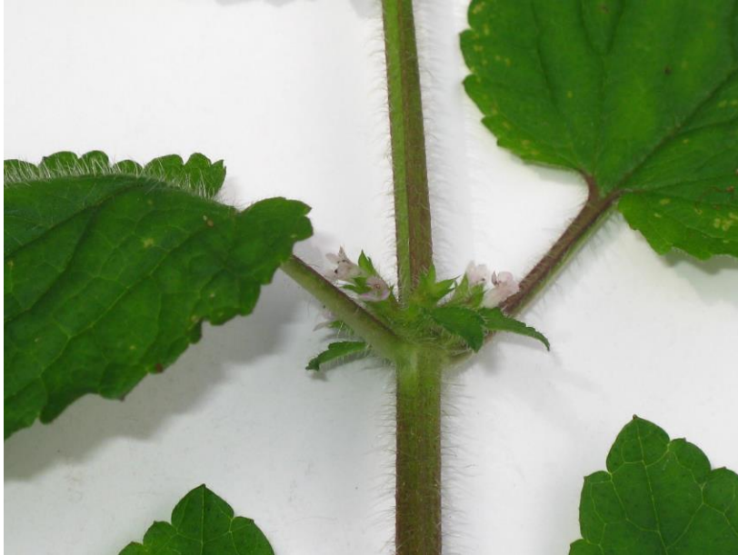
Figura 5. Tallo y Flores de Stachys gilliesii