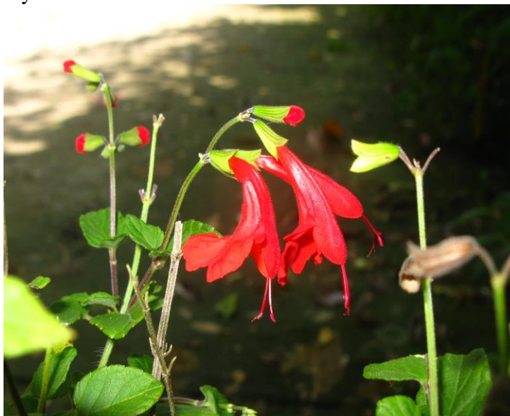
Figura 12. Flores y hábito de Salvia coccínea

Ejemplares examinados. Magdalena: Santa Marta, Corregimiento Minca, Cuenca Media del río Gaira 670 msnm, 24 sep 2011, N. Chávez 022 fl (UTMC). Otros ejemplares examinados: Meta: Aguas claras puente colgante río Ariari 760- 800 msnm, 26 oct 1995, J, L, Fernández 12882 fl (COL); Mocoa: Vereda San Jose del Pepino centro experimental Amazonia 1°05'N–76°40'O 500 msnm, 17 jul 1996 Diego M. Diaz 13 fl (COL)