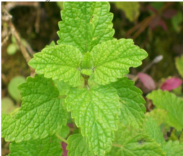
Figura 8. Hábito de Melissa officinalis