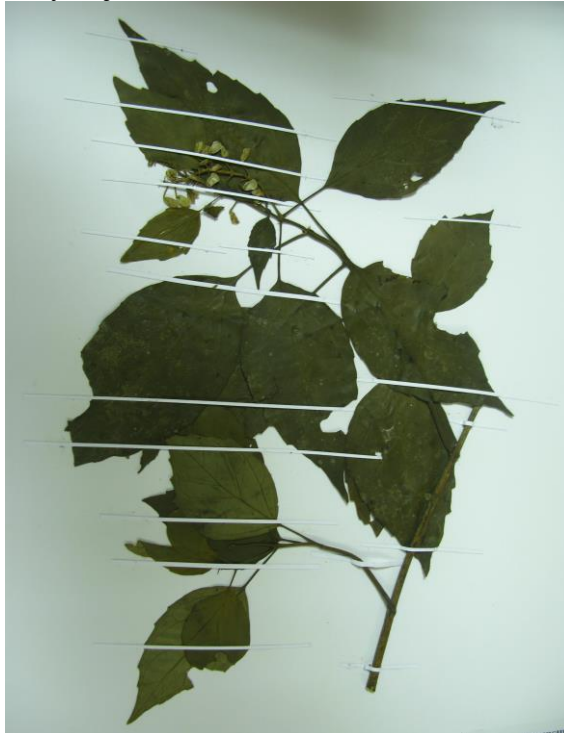
Figura 26. Inflorescencia y hojas de Scutellaria cf. Incarnata