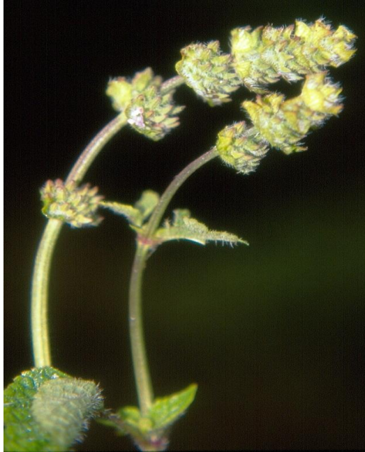
Figura 13. Inflorescencia y hábito de Salvia lasiocephala

Fotografía: Fernández-Alonso (N. Chávez 005).