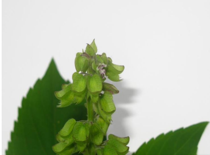
Figura 24. Inflorescencia de Ocimum campechianum

Rancheria, Sabanas de Guasca 540 msnm, 18 nov 1991, H. Dueñas y F. Cortes . 727 fl (COL).