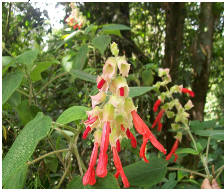
Fotografía : D. Yepes (N. Chávez 008)

15. Salvia occidentalis Sw., Prodr. Veg. Ind. Occ. 14. 1788.