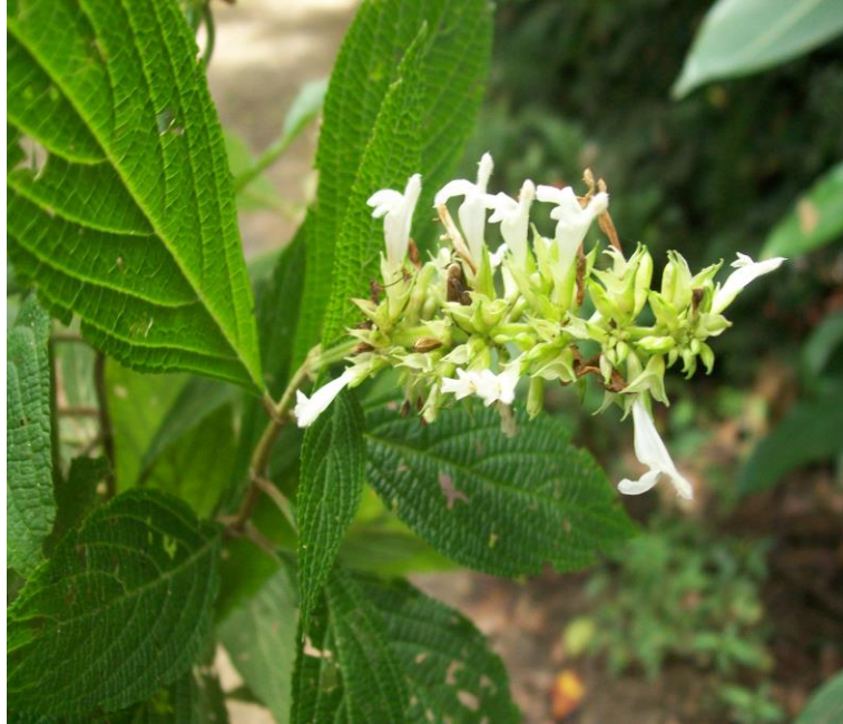
Figura 11. Flores y hábito de Salvia carbonoi