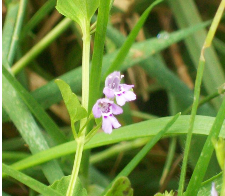
Figura 6. Flores y hábito de Clinopodium brownei

Fotografía: J. Hernández (N. Chávez 010).