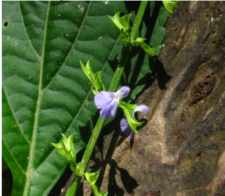
Figura 10. Flores de Salvia angulata