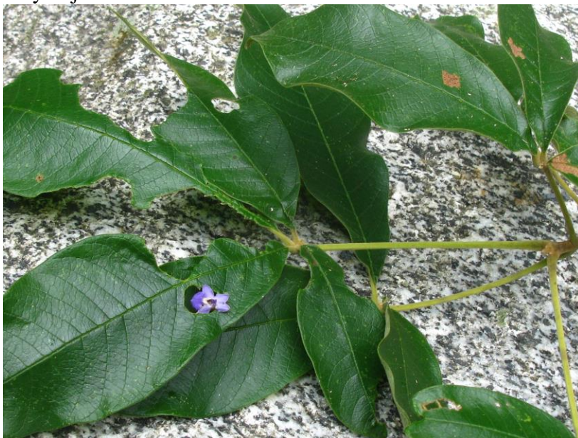
Figura 28. Flor y hojas de Vitex cymosa

Ejemplares examinados. Magdalena: Sierra Nevada de Santa Marta, Bocatoma, cuenca baja del río Gaira, 11°09'04.1"N-74°06'52.5"O, 270 msnm, 19 jun 2011, N.Chavez 015 , fl-fr (UTMC). Otros ejemplares examinados: Guajira: Serranía la Macuira región Jassai vecinidad de la Duna Arehuara, 4 mar 1963, C. Saravia T. 2339 st (COL) ; Km 7 de Buenos Aires rumbo a Nuevo ambiente, 4 abr 1962, Carlos Saravia y Donlad Johnson 403 st (COL) .