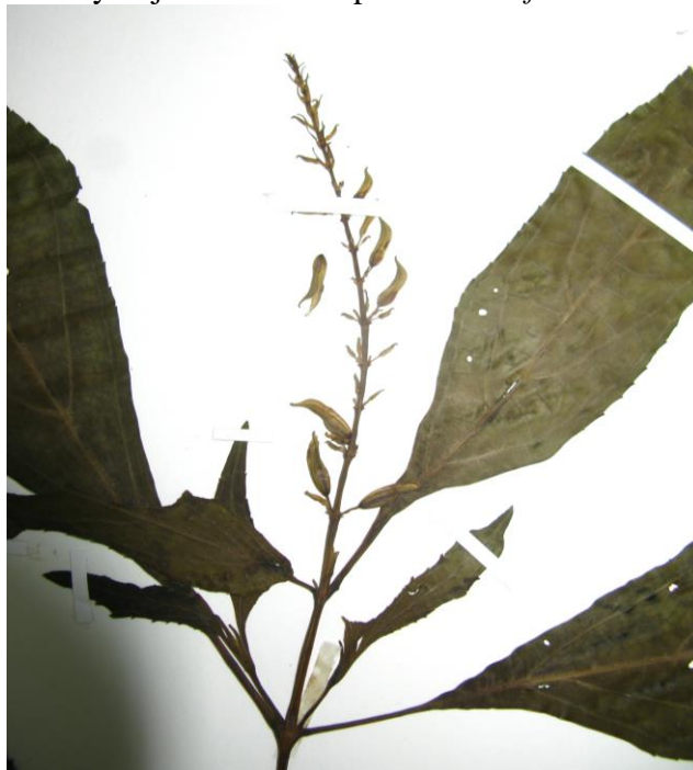
Figura 18. Inflorescencia y hojas de Salvia sp. Sec. Tubiflorae

Fotografía: N. Chávez ( E. Carbonó 4288).