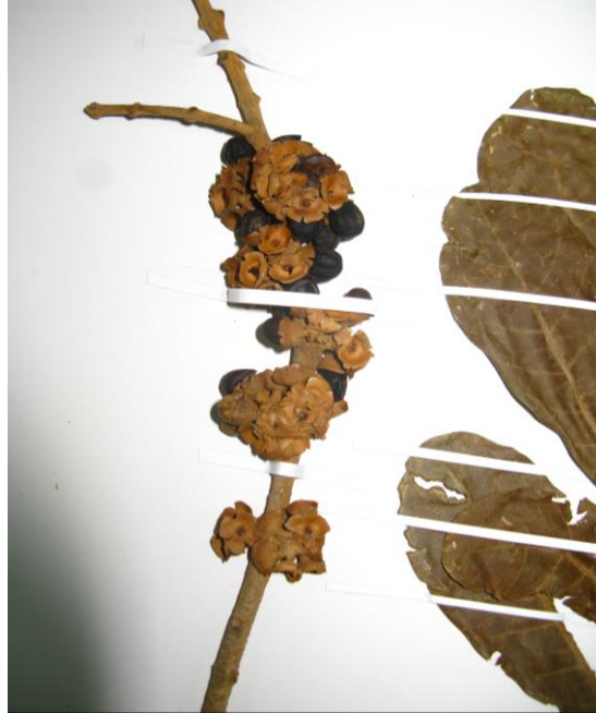
Figura 3. Frutos y hojas de Aegiphila grandis .

Fotografía: N. Chávez (E. Carbonó 2354).