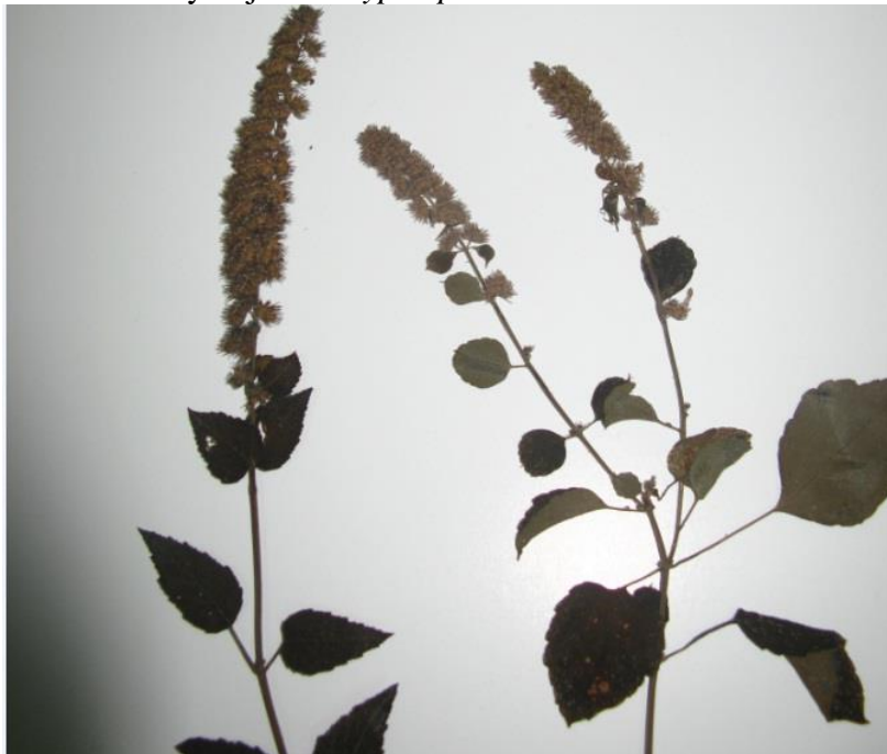
Figura 21. Inflorescencia y hojas de Hyptis pectinata

Ejemplares examinados. Magdalena: Santa Marta, Sierra Nevada de Santa Marta, hacienda La Victoria, cuenca media del río Gaira 1569 msnm, 29 ene 2011, Bocatoma cuenca baja del río Gaira 663 msnm, 19 jun 2011, N. Chávez 006 fl (UTMC). Otros ejemplares examinados: Flanco Norte de la Sierra Nevada, feb 1948, R. Romero Castañeda 716 fl (COL); Ciénaga, feb 1950 fl (COL). Guajira: Dibulla-Mingueo 11°14'29"N–73°22'47"O, 14 msnm, 19 Dic 2003, S. Bohórquez 3p-1 fl (COL):