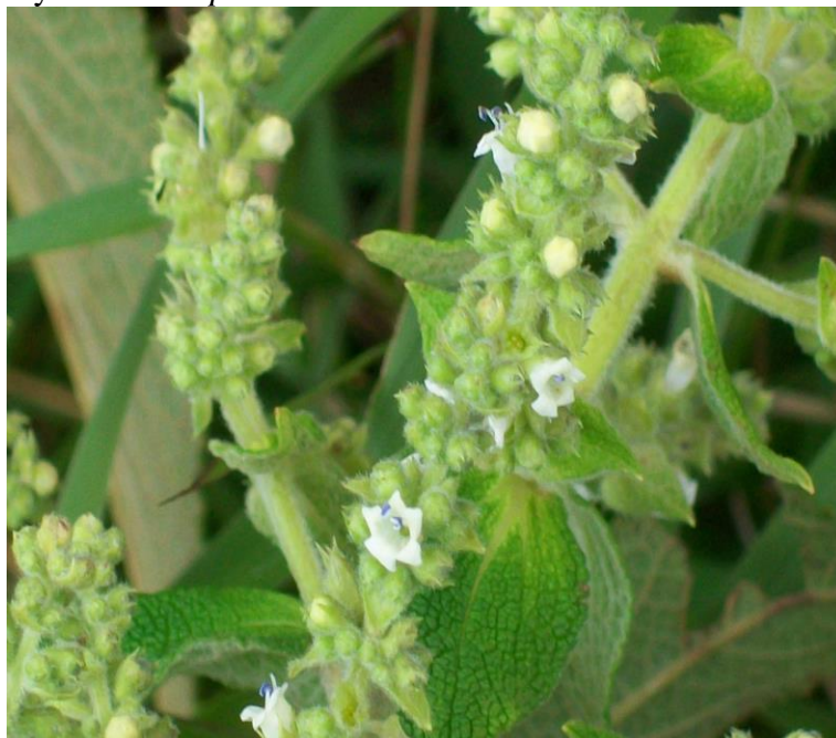
Figura 7. Flores y hoas de Lepechinia bullata

Fotografía: J. Hernández (N. Chávez 009).