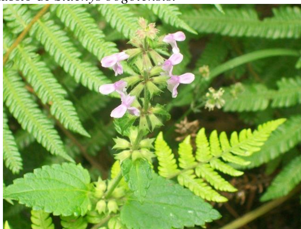
Figura 4. Flores y hábito de Stachys bogotensis .

Ejemplares examinados. Magdalena: Santa Marta, Sierra Nevada de Santa Marta, San Lorenzo- Cerro Kennedy, cuenca alta del rio Gaira, 2716 msnm, 13 may 2011, N. Chávez 007 fl (UTMC); estación San Lorenzo 2300 msnm, 30 jun 1984, E. Carbono 928 fl (COL).