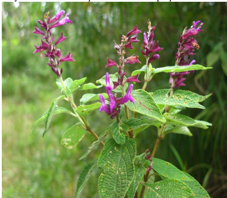
Figura 16. Flores y hábito de Salvia sphacelioides subsp. sphacelioides

Ejemplares examinados. Magdalena: Sierra Nevada de Santa Marta, cuenca alta del río Gaira, San Lorenzo-Cerro Kennedy 11°06'31,8"N-74°02'46,1"O, 2618 msnm, 24 dic 2011, N. Chávez 016 fl (UTMC). Otros ejemplares examinados: Sierra Nevada de Santa Marta, pendientes del Sureste Hoya del río Donachui 2400-2650 msnm, 10 oct 1959, J. Cuatrecasas y R. Romero Castañeda 24705 fl (COL); Valle del río Donachui Sogrome- Sacaracunge 1880 msnm, 13 oct 1958 Th. Varder Hammen 1080 fl (COL); San Sebastián 6200 msnm, 17 ago 1946, M. B. Foster y Earle Smith 1508 fl (COL). Otros ejemplares examinados: Cesar: Sierra Nevada de Santa Marta río Donachui Sogrome- Nevadita 2000-3000 msnm, 13 jul 1985, J R. I. Wood 4975 fl (COL).