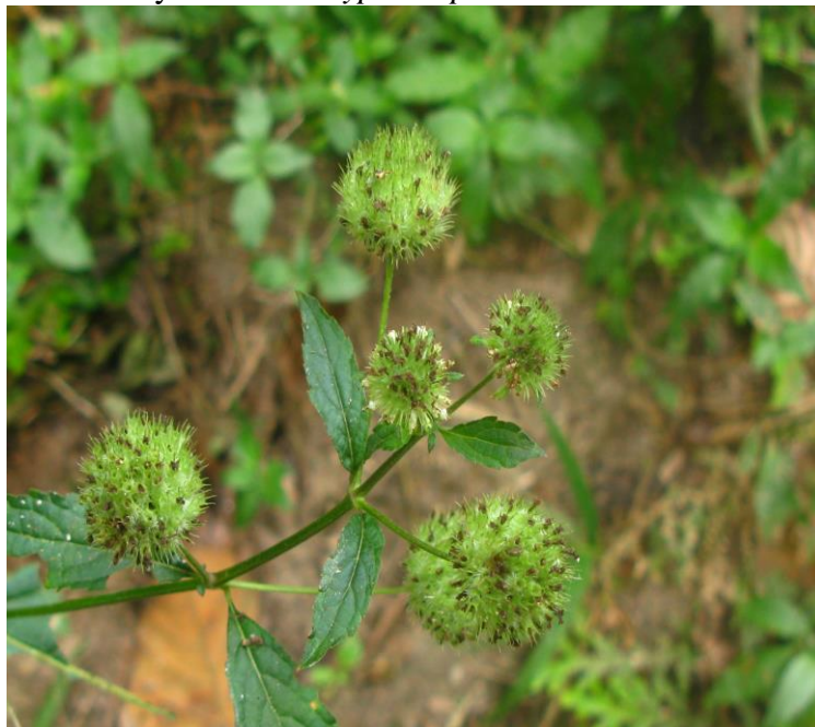
Figura 20. Inflorescencia y hábito de Hyptis capitata