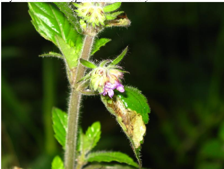
Figura 23. Flor y hábito de Marsypianthes chamaedrys

Ejemplares examinados. Magdalena: Santa MartaSierra Nevada de Santa Marta, cuenca media del río Gaira 11°06'18.1"N-74°05'16"O 1452 msnm, 15 may 2011, N. Chávez 013 fl (UTMC). Otros ejemplares examinados: Cesar: Hacienda Curucu, Poponte, cerca de Chiriguana 150 msnm, 28 dic 1948, J. R. I. Wood 4683 fl (COL); Guajira: Riohacha, 20 msnm, 27 nov 1944, Oscar Haught 4461 fl (COL); Atlántico: Baranoa- Galapa 120-140 msnm, 16 dic 1961, A. Dugand 5931 fl (COL).