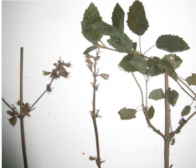
Figura 22. Inflorescencia y hojas de Hyptis suaveolens

Guajira: SNSM, Municipio San Juan, Marocasa, Arrollo el Rincón, 540 msnm, 16 nov 1991, H. Dueñas y F. Cortes 656 fl (COL).