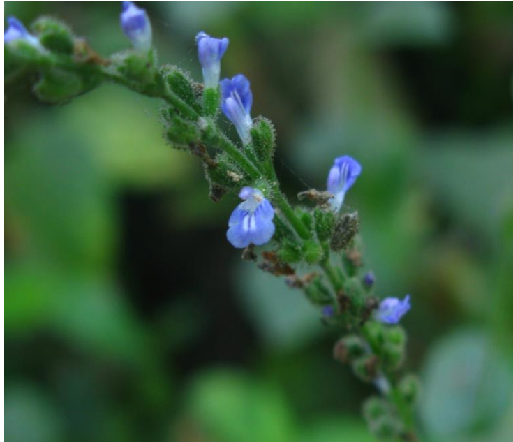
Figura 15. Flores y hábito de Salvia occidentalis

Carbonó 648 fl (COL); Minca SNSM, Vereda Mundo Nuevo, Finca San Roque 52 msnm, 12 feb 2009, D. Obregon et al 92 fl (COL).