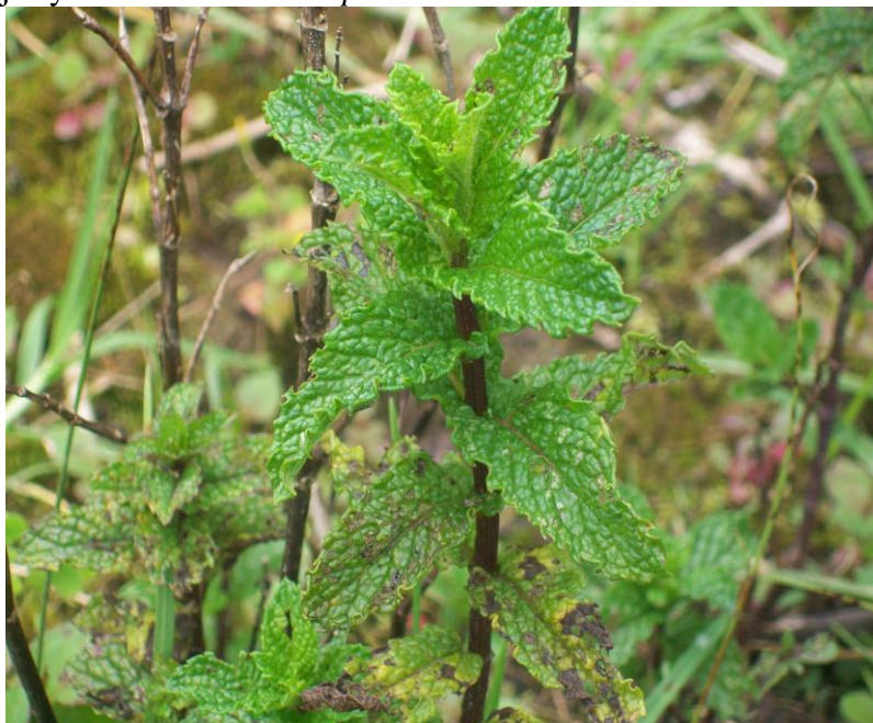
Figura 9. Hojas y hábito de Mentha spicata

Ejemplares examinados. Magdalena: Santa Marta, cuenca alta del río Gaira, San Lorenzo, 2200 msnm, 20 ago 2011, N. Chávez 017 (UTMC). Otros ejemplares examinados: Cundinamarca: Bogotá 2600 msnm, 22 feb 1980, H. García Barriga 21185 (COL); San Antonio de Tequendama, Finca Buenos Aires 2800 msnm, ago 1991, Silvia Rodríguez 001 st (COL); Santander: Floridablanca Vereda Brasil y el Mortiño, 1600-1900 msnm, 20 jun 2004, J.L. Fernández 21419 st (COL).