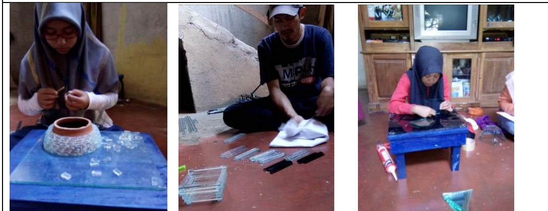
Monitoring Proses Pembuatan