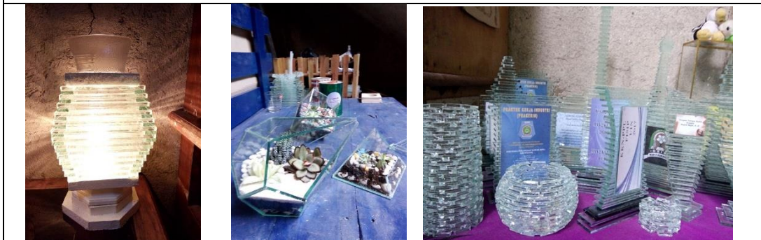
Hasil Produk yang di buat