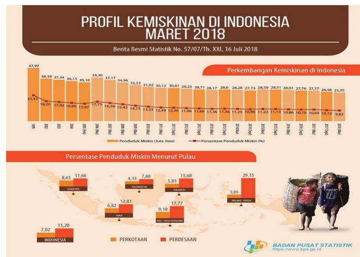
Gambar 3 Profil Kemiskinan di Indonesia

Kondisi sosial ekonomi keluarga memiliki pengaruh pada pola konsumsi pangan secara makro, dimana jika pendapatan keluarga semakin besar maka semakin beragam pola konsumsi masyarakat. Pendapatan keluarga merupakan faktor yang mempengaruhi kualitas dan kuantitas makanan yang dikonsumsi oleh seluruh anggota keluarga, hal ini juga akan berpengaruh pada uang saku anak dan kebiasaan anak untuk makan. Sanjur (1982) menambahkan bahwa keluarga yang memiliki anggota keluarga banyak akan mempengaruhi belanja pangan, dimana pendapatan perkapita dan belanja pangan akan menurun sejalan dengan meningkatnya jumlah anggota keluarga. Menurut data BPS (2018) pada bulan maret jumlah penduduk miskin di Indonesia mencapai 25,95 juta orang (9,82%), berkurang sebesar 633,2 ribu orang dibandingkan dengan kondisi September 2017 yaitu 26,58 Juta orang (10,12%). Diharapkan dari berkurangnya angka kemiskinan maka akan memperbaiki pola konsumsi masyarakat Indonesia.