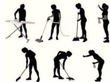
Gambar 4 Aktivitas fisik

Aktivitas fisik manusia mempengaruhi kadar hemoglobin dalam darah. Individu yang secara rutin berolahraga kadar hemoglobinnya akan naik. Hal ini disebabkan karena jaringan atau selakan lebih banyak membutuhkan O 2 ketika melakukan aktivitas. Tetapi aktifitas fisik yang terlalu ekstrim dapat memicu terjadinya ketidakseimbangan antara produksi radikal bebas dan sistem pertahanan antioksidan tubuh, yang dikenal sebagai stres oksidatif. Pada kondisi stres oksidatif, radikal bebas akan menyebabkan terjadinya peroksidasi lipid membran sel dan merusak organisasi membran sel. Peroksidasi lipid membran sel memudahkan sel eritrosit mengalami hemolisis, yaitu terjadinya lisis pada membran eritrosit yang menyebabkan Hb terbebas dan pada akhirnya menyebabkan kadar Hb mengalami penurunan. Hal yang berbeda diungkapkan dalam penelitian Chibriyah (2017) dengan nilai P 0,623 dan Kosasi (2014) dengan uji analisis Mann Whitney 0,265 maka dapat disimpulkan bahwa tidak ada hubungan antara aktivitas fisik dengan kadar hemoglobin