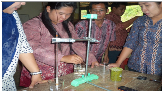
Foto Kegiatan Praktikum