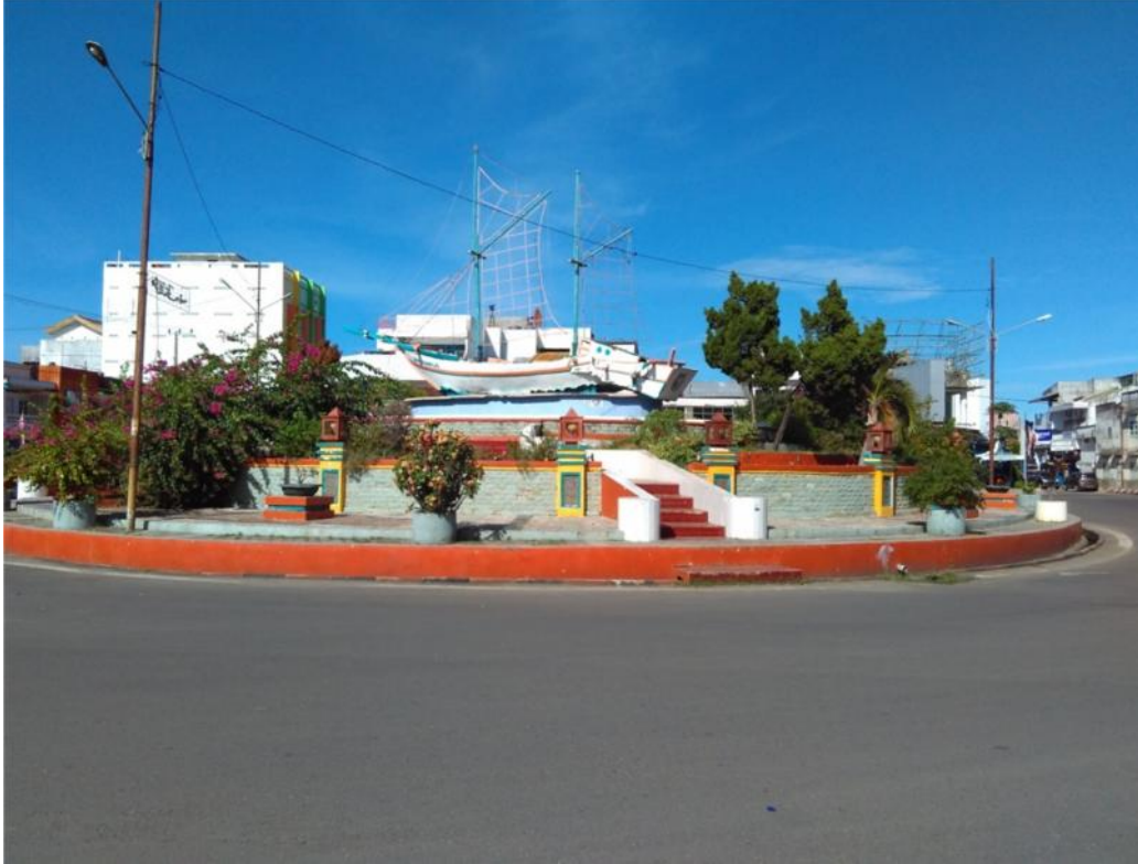
Patung Perahu Pinisi