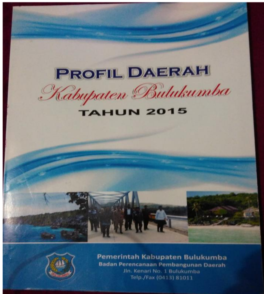
Buku Profil Kabupaten Bulukumba