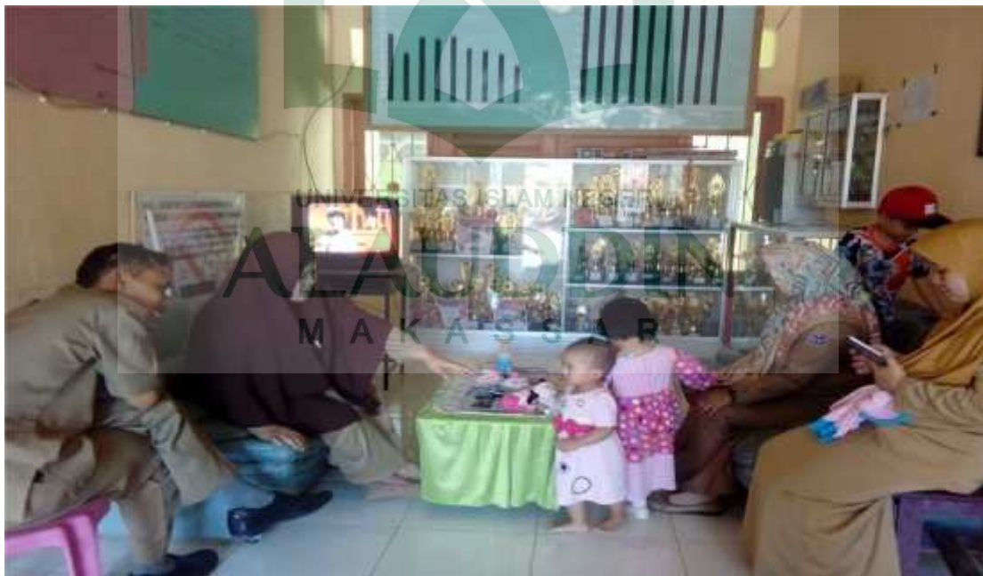
Gambar lampiran 7: Wawancara anggota biasa KPRI SMPN 1 Baraka