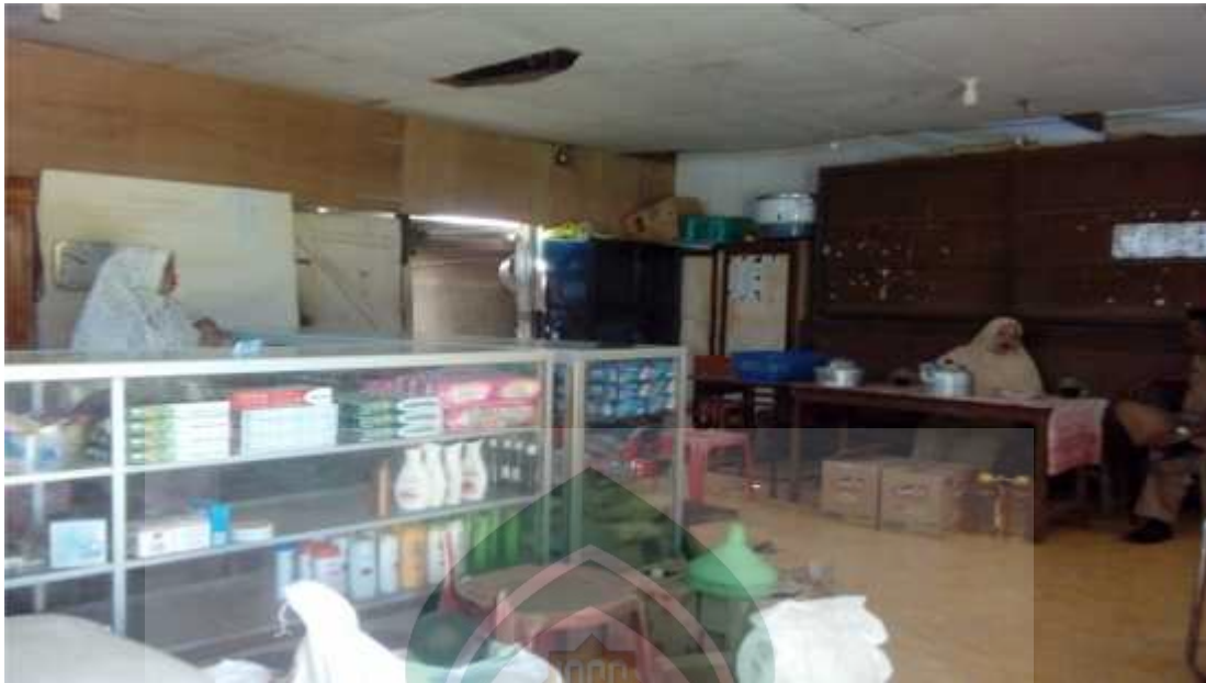
Gambar lampiram 5: Wawancara Pemasok KPRI SMPN 1 Baraka