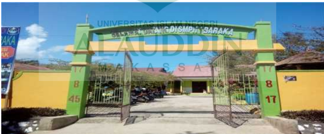
Gambar lampiram 2: Lokasi KPRI SMPN 1 Baraka