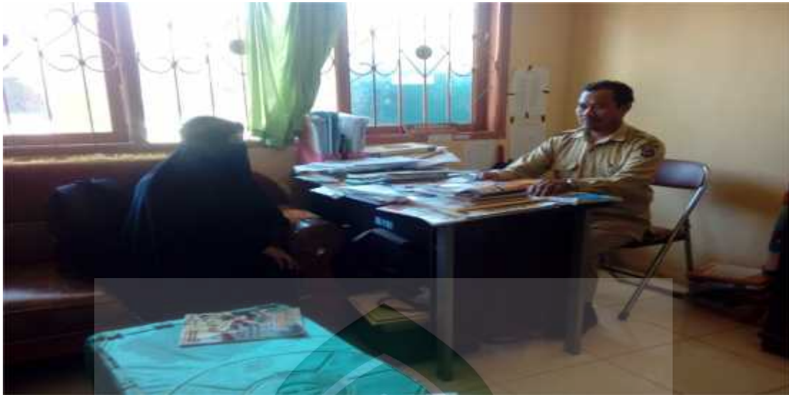
Gambar lampiram 3: Wawancara Ketua KPRI SMPN 1 Baraka