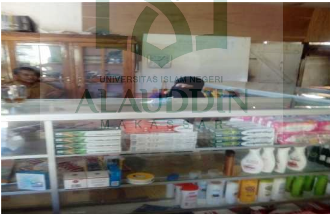
Gambar lampiram 6: wawancara penjualan koperasi KPRI SMPN 1 Baraka