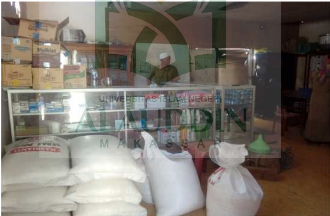
Gambar lampiram 4: Wawancara Bendahara KPRI SMPN 1 Baraka