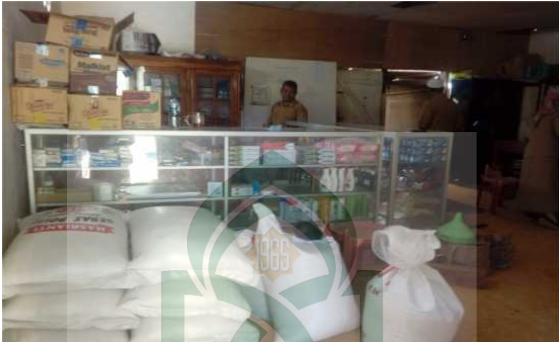
Gambar lampiram 1: Kondisi KPRI SMPN 1 Baraka