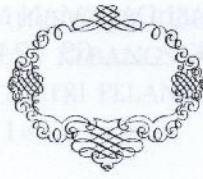
TABLE OF CONTENTS