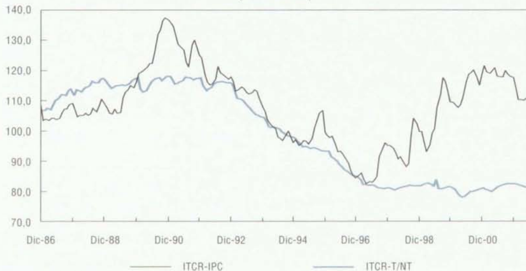
Gráfico 2 Definiciones de la tasa de cambio real Transables y no transables (ITCR-T/NT) y de paridad de compra (ITCR-IPC) (1994 = 100)