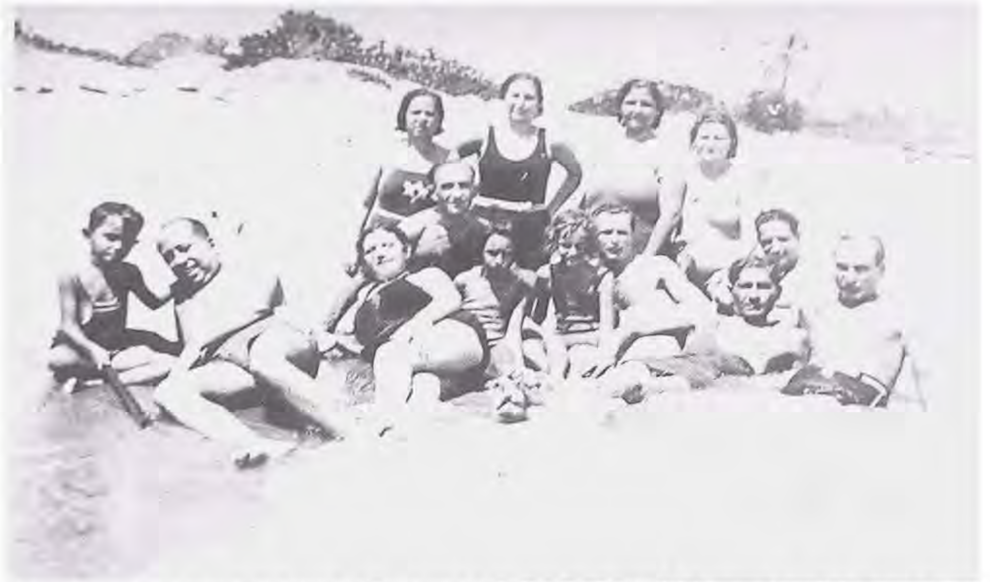
Grupo de bañistas árabes en la playa de Cartagena a principios del siglo XX.