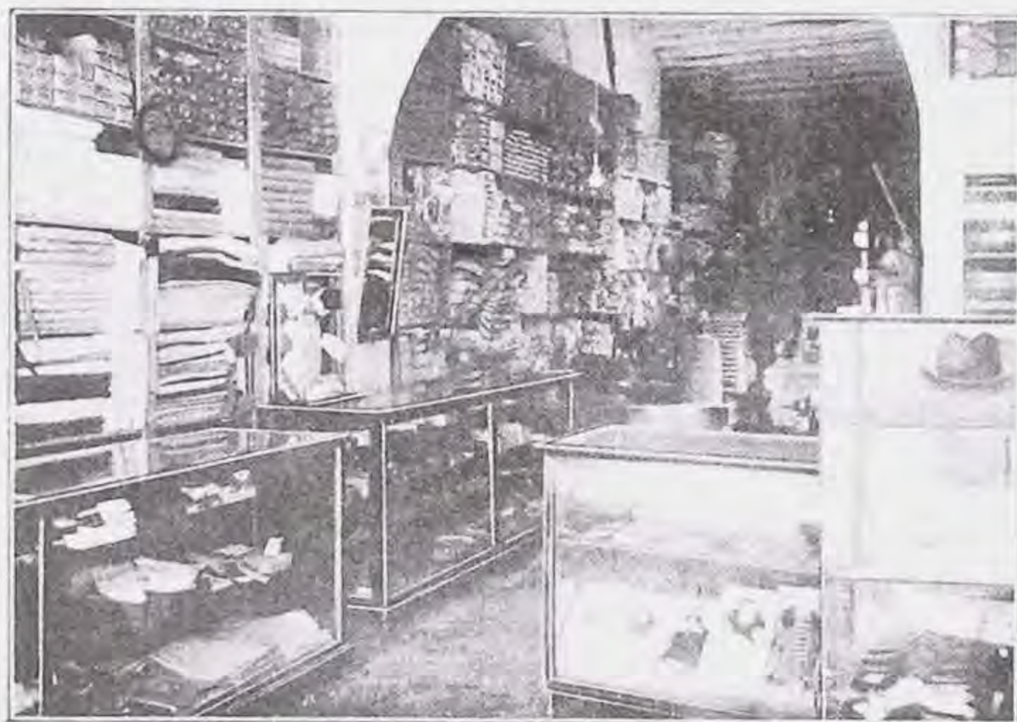
Parte del Almacén de los señores Abidaud Hermanos

ESTAAcre- ditada Casa gira en artículos para cabal- leros, telas de algodón, mercería, juguetería, perfume- ría, som- brerería y toda clase de noveda- des, etc.