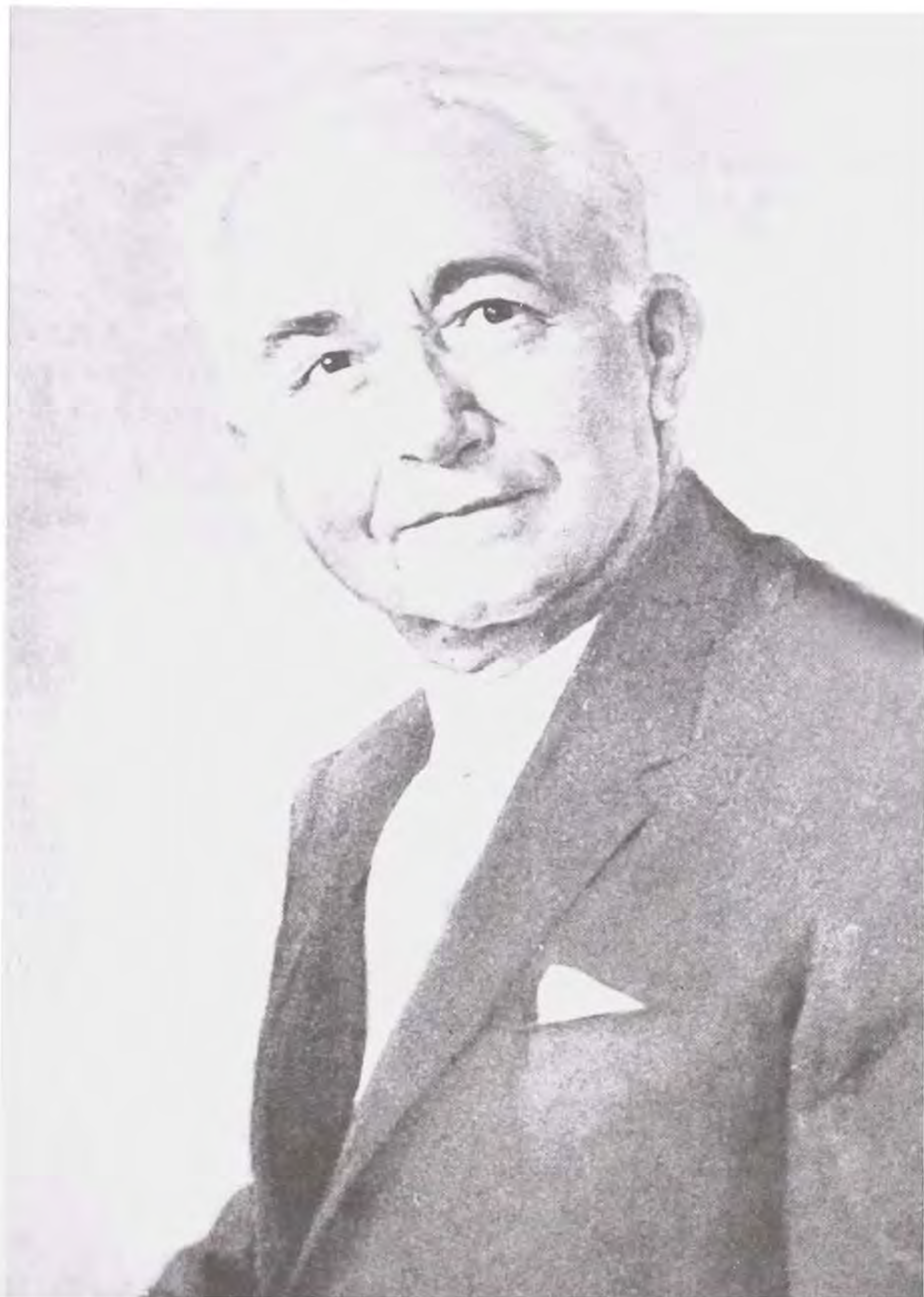
Evaristo Sourdis, político costeño de origen sefardí.

de origen levantino y europeo. Como en los casos anteriores, el centro de sus actividades en la costa fue Barranquilla, donde pronto ascendieron a posiciones prominentes en el sector industrial 4 . Para ese entonces, Barranquilla no sólo era el principal puerto del país, sino también la tercera ciudad industrial más importante, con una comunidad de inmigrantes bien establecida y bastante numerosa, que le daba a la ciudad un aire cosmopolita muy particular. En palabras de un visitante español, "Barranquilla, de todas las ciudades de Colombia, es aquella en la que domina el espíritu cosmopolita" 5 .