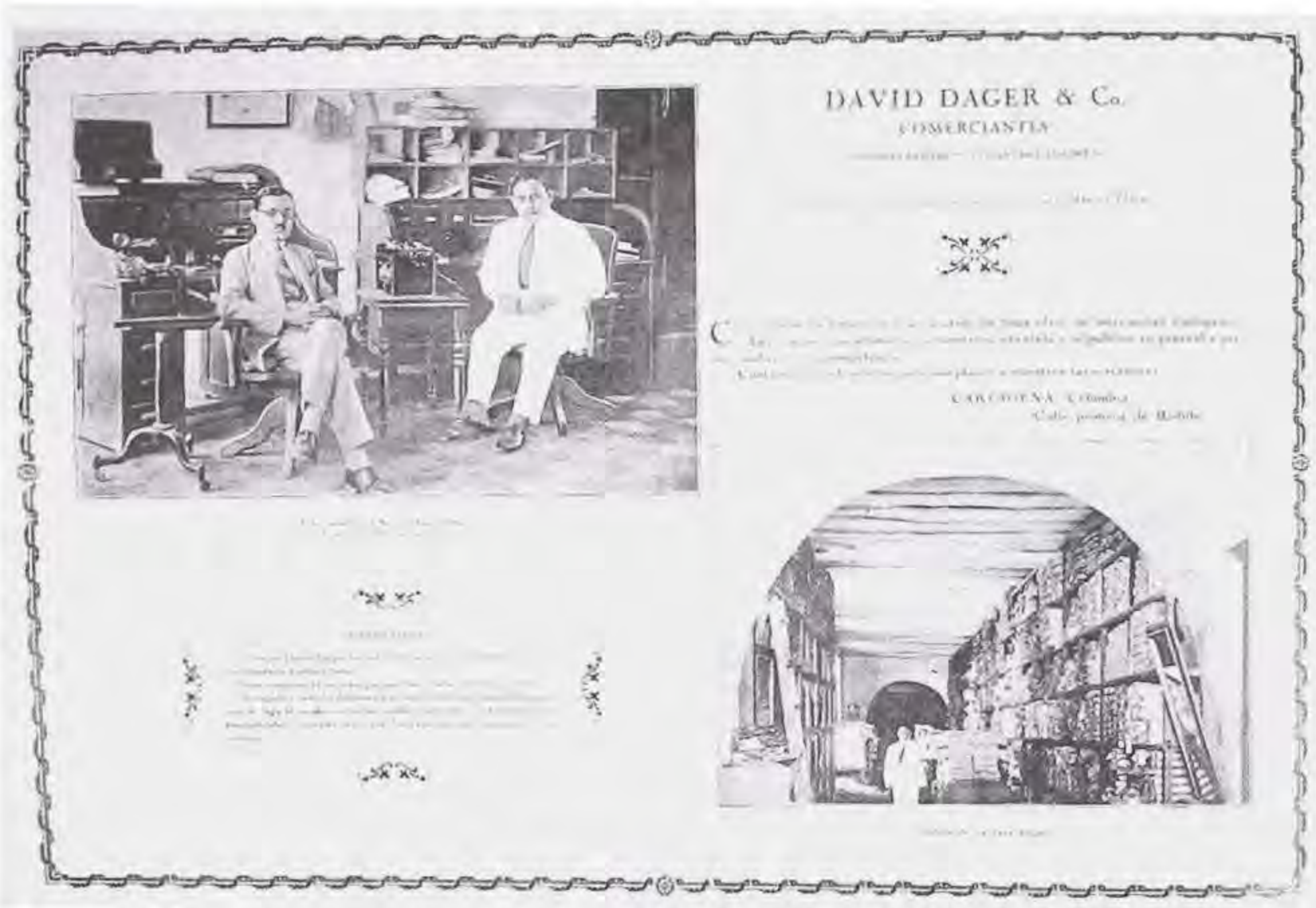
Aviso publicitario.

Barranquilla, aunque esto simplemente refleja el hecho de que las cifras comprendidas en ellas eran mucho menores.