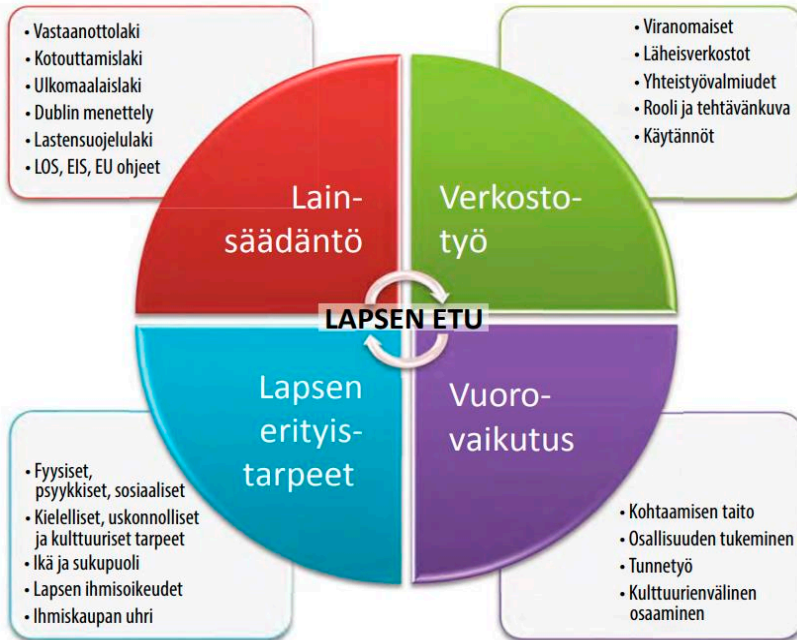
Kaavio 1. Edustajan osaamisalueet ja työn sisällöt (Lundqvist & Vaitomaa 2014, 124.)