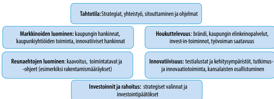
Kuva 3. Kaupunkien rooleja innovaatioekosysteemin kehittämisessä

Kaupungeilla on selkeä rooli innovaatioekosysteemissä neutraalina fasilitaattorina ja koordinaattorina, jonka kanssa kaikkien toimijoiden on helppo tehdä yhteistyötä. Kaupungit mahdollistavat kehitystä kutsumalla kokoon eri tahoja ja tarjoamalla fasilitetteja yhteistyölle. Kaupungin rooli ja toimintamahdollisuudet vaihtelevat eri tilanteissa ja riippuvat myös toimialoista ja teemoista, mutta yleisesti kaupunkien merkitys innovaatioekosysteemien toimijoina on kasvussa. Käytännön kehitysympäristöjen ja innovaatioalustojen kohdalla kaupungilla on usein kriittinen ja korvaamaton rooli toiminnan mahdollistajana (lupaprosessit, kaupunkilaisten osallistaminen, omien toimintojen avaaminen ja asiakkaana toimiminen). Kuvassa 3 on haahmoteltu näitä kaupunkien tärkeimpiä rooleja ja toimintoja.