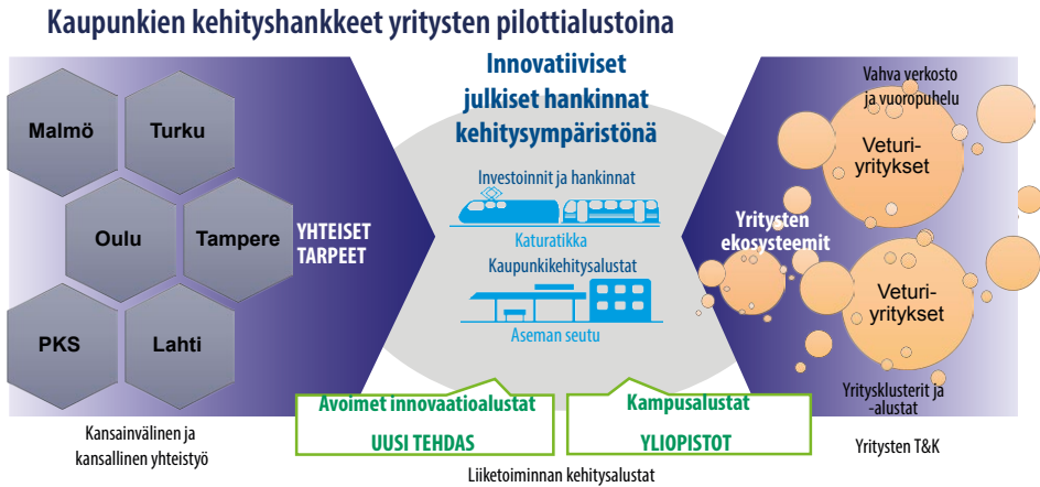
Kuva 2. Kaupunkien yhteiset kehityshankkeet INKA-ohjelmassa Tampereella 2

Biotaloudessa kullakin mukana olevalla kaupungilla oli oma teemansa: Joensuussa kestävä kasvua metsistä, Jyväskylässä resurssiviisas biotalous ja Seinäjoella ruokajärjestelmien kestävät ja tehokkaat ratkaisut. Älykäs kaupunki ja uudistuva teollisuus -teemat yhdistettiin Tampereen vetovastuun alle, ja ohjelma jakautui Tampereen vetovastuulla oleviin teemoihin ja muiden kaupunkien vetovastuulla oleviin teemoihin. Kyberturvallisuusteemassa oli mukana vain vetovastuullinen kaupunki, Jyväskylä, ja yhteistyötä tehtiin muiden teemojen rajapinnoilla (esim. energia- ja terveysturvallisuuden kyberturvallisuus).