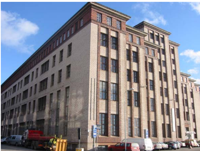
Muutama näistä on sittemmin vakiintunut pysyväksi taiteilijataloksi, kuten kuvan Kaapelitehdas 1990-luvulla Helsingissä Kaapelitehdas, osa on siirtynyt muuhun käyttöön (mm. Tampereella Finlayson, Helsingissä Sörnäisten alue) ja osan tulevaisuus on yhä epäselvä (esim. Helsingin Herttoniemi ja Turun Jokikatu).

1980-luvun lopulla ja 90-luvulla suurimmissa keskuksissa tuli tarjolle tyhjentyneitä teollisuusrakennuksia, joista taiteilijat saattoivat vuokrata työtiloja. Useimmissa tapauksissa taiteilijat tekivät yksittäisiä, usein lyhyitä vuokrasopimuksia kiinteistöjen omistajien kanssa ja näin muotoutui vähitellen taiteilijayhteisöjä. Uutta pysyvää käyttöä tai purkamista odottavien kiinteistöjen vuokrat olivat taiteilijoille sopivan edullisia.