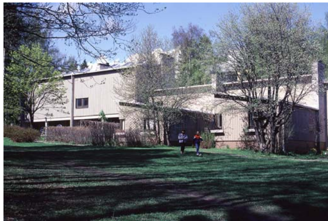
1950-luvulla alkoi ateljee-asuinrivitalojen rakentaminen

Opetusministeriön työryhmämuistioita ja selvityksiä 2004:2