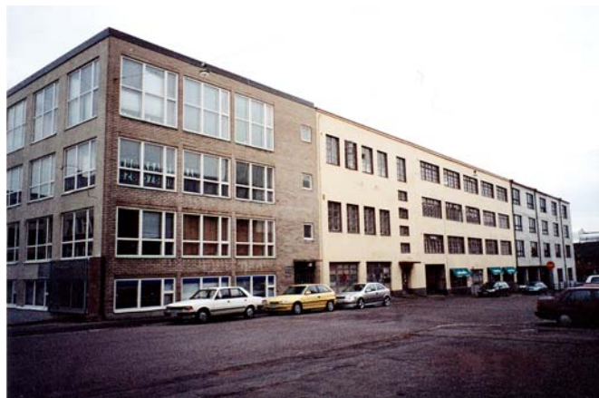
1990-luvulla työtilojen painopiste siirtyi entisiin teollisuusrakennuksiin

Opetusministeriö • Kulttuuripolitiikan osasto • 2004