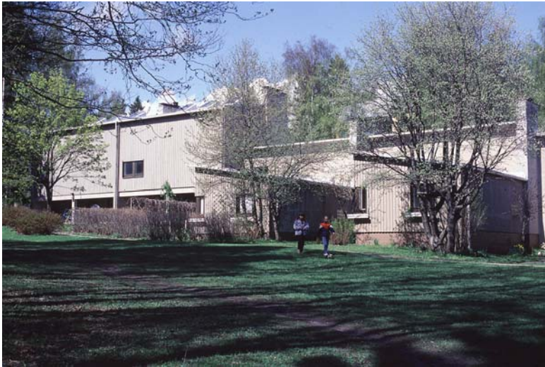
Ensimmäinen ateljeerivitalo rakennettiin Tapiolan Nallenpolulle vuonna 1955