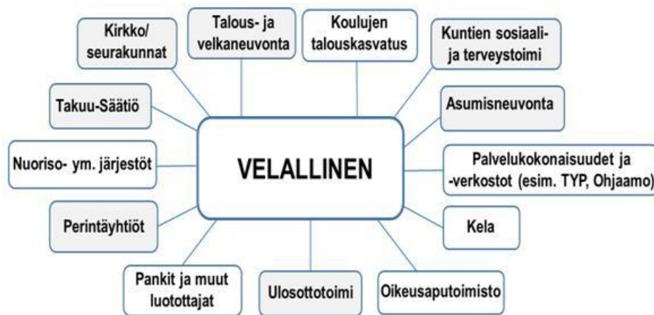
Kuvio 2. Ylivelkaantumisen ehkäisyyn ja hoitoon liittyviä toimijoita ja palveluita

Tässä luvussa keskiössä ovat ylivelkaantumisen ehkäisyyn ja hoitoon liittyvät sekä tarjolla olevat palvelut, erilaiset toimijat ja palveluiden toimivuus, joita tarkastelemme kuluttajien, tai asiakkaiden, näkökulmasta. Erilaisia toimijoita on koottu kuvioon 2. Keskeisiä ylivelkaantuneita asiakkaita koskettavia toimijoita - talous- ja velkaneuvonta, kuntien sosiaali- ja terveystoimi, kirkko/seurakunnat, Takuu-Säätiö, perintäyhtiöt, ulosotto- ja haastattelu - haastattelu on saatu monipuolinen näkemys siitä, miten ylivelkaantuneille tarkoitetut erilaiset palvelut, tuet ja koko palvelujärjestelmä velallisen näkökulmasta toimivat, mitkä ovat keskeisiä epäkohtia ja miten palveluita tulisi kehittää.