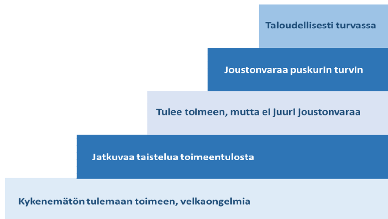
Kuvio 3. Taloudellisen hyvinvoinnin portaat (Money Advice Service 2015a)