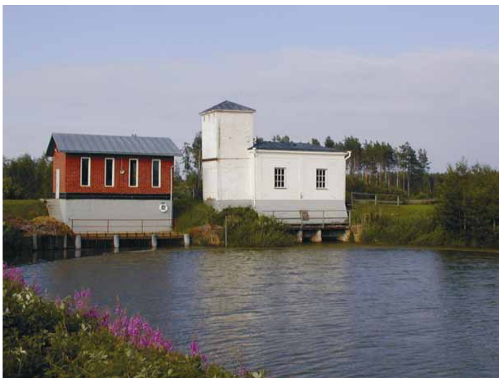
Bild 2. Den gamla pumpstationen till höger fungerar numera som museum.

I mitten av 1990-talet påbörjades gemensamt en reglering av täckdikningen. Tack vare den kan surhetsgraden hållas under kontroll, vilket förutom lantbruksnyttan också har betydelse för vattnets kvalitet i Södra Stadsfjärden dit vattnet rinner ut. Omfattningen av denna reglering är också unik i europeiskt perspektiv, bl.a. är det sammanlagt fråga om fler än 500 regleringsbrunnar.