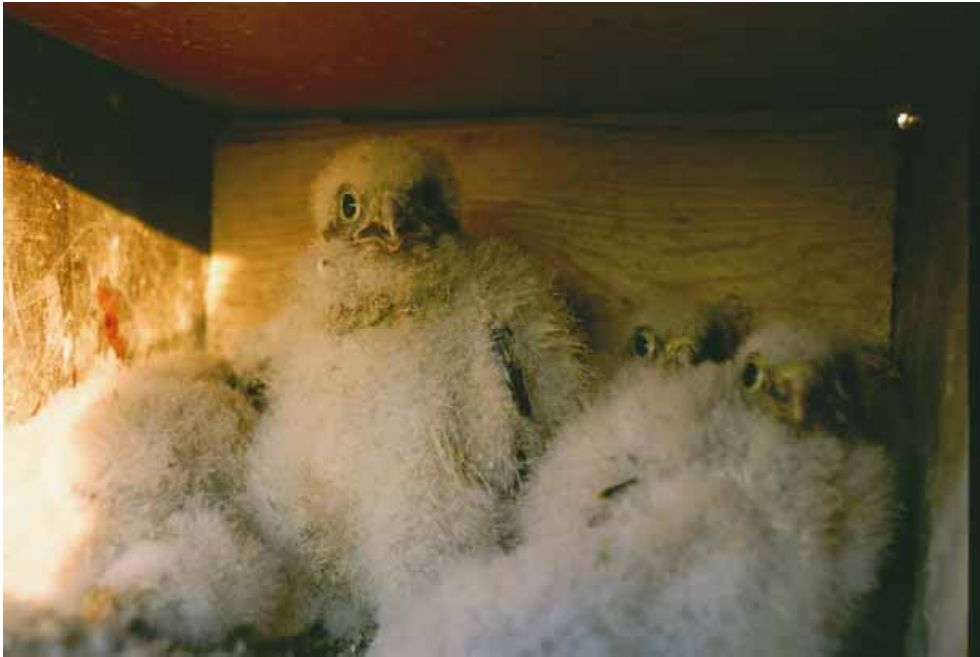
Bild 3. Tornfalken är en av de fåglar som häckar i holkar uppsatta på ladorna på Söderfjärden.