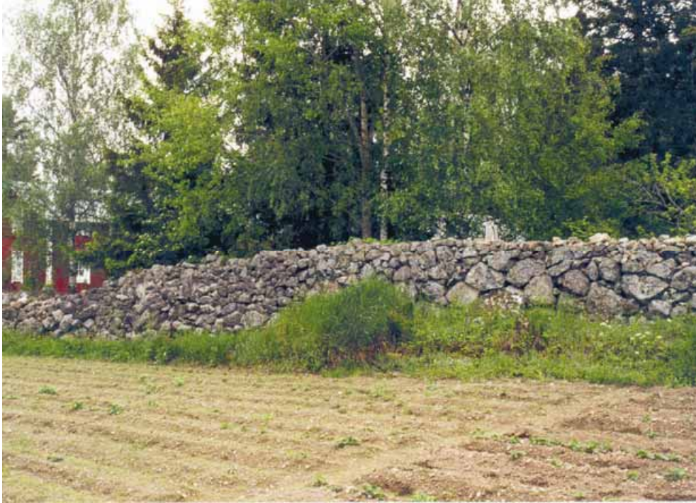
Bild 7. En väl bevarad stengårdsgård i Sundom.