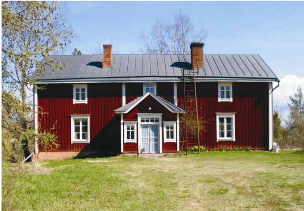
Bild 8. Ett exempel på det äldre byggnadsbeståndet, som karakteriserar den bebyggda miljön. Huset finns på Norrbacken i Sundom.