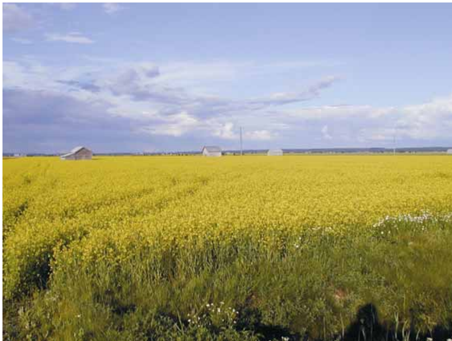
Bild 5. På Söderfjärdens imponerande odlingslätt finns fortfarande några lador och rior bevarade.

Om man ser på områdets skogar i mindre skala är skogsbrynen och skogsholmarna värdefulla element, som dock båda kräver viss skötsel för att bli riktiga pärlor i landskapet.