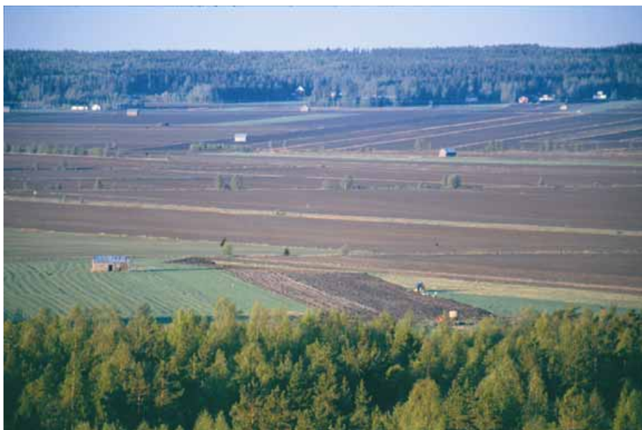
Bild 9. Skogskanten runt Söderfjärden ramar in landskapet och är därför landskapsmässigt viktig.

För Öjbergets generalplanerade del gäller planebestämmelserna för skogsbruk. På de områden som märkts med MU1 (skogsbruksområde som är miljömässigt värdefullt) i planen gäller att föryngringshyggen över 1 ha är förbjudna. Samtidigt förutsätts att de kalhuggna områden omedelbart planteras med för området typiska trädslag. Avverkningarna bör följa terrängens former och också annars bevara naturens särdrag. Bergets krön är betecknat med SL, dvs. naturskyddsområde. Här tillåts inga andra skogsbruksåtgärder än att fälla träd för hushållsbehov för privata lägenheter.