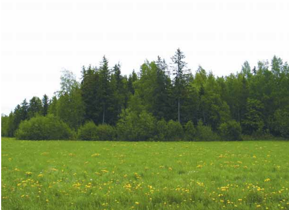
Bild 10. För skapande och upprätthållande av ett mångformigt skogsbryn kan man få jordbrukets miljöspecialstöd.

För skapande och upprätthållande av en mångformig skogsrand mellan åker och skog passar jordbrukets miljöspecialstöd mycket bra (bild 10). I övrigt kan man för bevarande av skogslagens värdefulla livsmiljöer söka skogsbrukets miljöstöd . De värdefulla livsmiljöerna är kartlagda av skogscentralen och uppgifter om dessa har skickats ut åt skogsägarna. De typer av viktiga livsmiljöer det är fråga om i de skogar som finns inom landskapsområdet är främst trädfattiga torvmarker och mindre bergsområden.