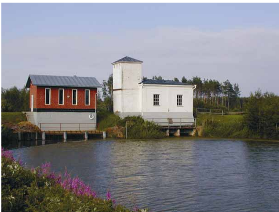
Kuva 2. Oikealla oleva vanha pumppaamo toimii nykyään museona.

1990-luvun keskivaiheilla aloitettiin yhteinen salaojien järjestely. Sen ansiosta happamuutta voidaan kontrolloida, mikä maataloudellisen hyödyn lisäksi vaikuttaa myös veden laskupaikan eli Eteläisen kaupunginselän vedenlaatuun. Tämän järjestelyn laajuus on myös eurooppalaisessa mittakaavassa ainutlaatuinen, esimerkiksi hankkeen yhteydessä alueelle sijoitettiin yli 500 säätösalaojakaivoa.