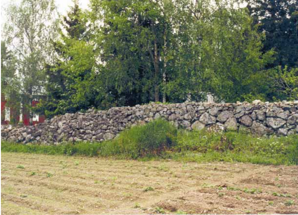
Kuva 7. Hyvin säilynyt kiviaita Sundomissa.