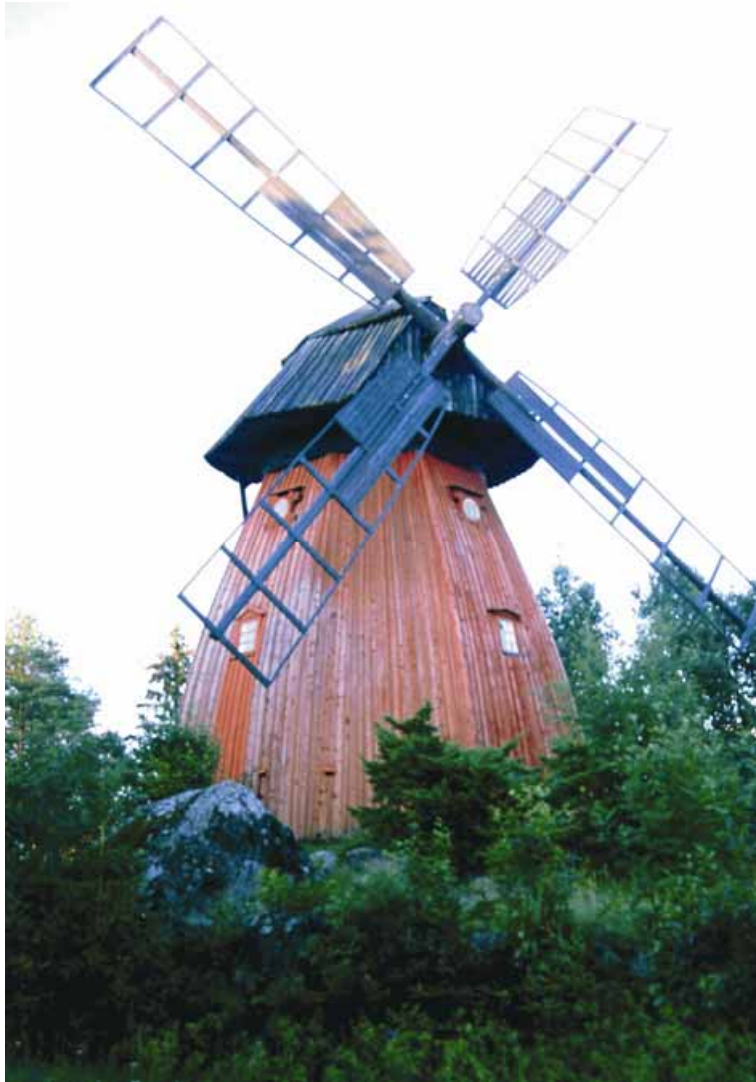
Kuva 6. Södersundin mamsellityyppinen tuulimylly on yksi rakennushistoriallisesti arvokkaimista kohteista, jotka ovat ominaisia maisemassa.