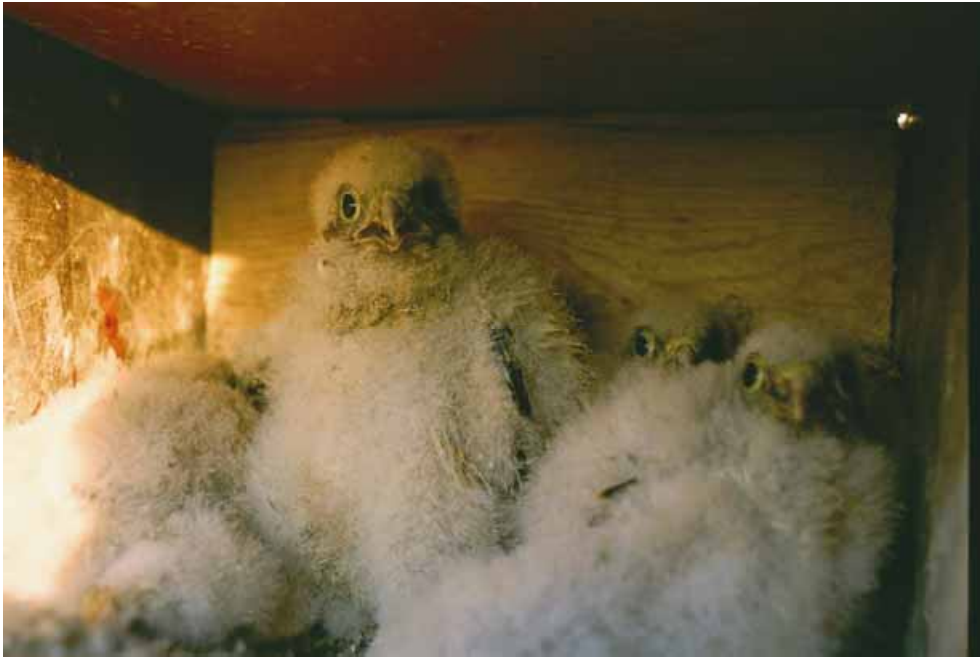
Kuva 3. Tuulihaukka on yksi Söderfjärdenin latojen seinille ripustetuissa pöntöissä pesivistä linnuista.