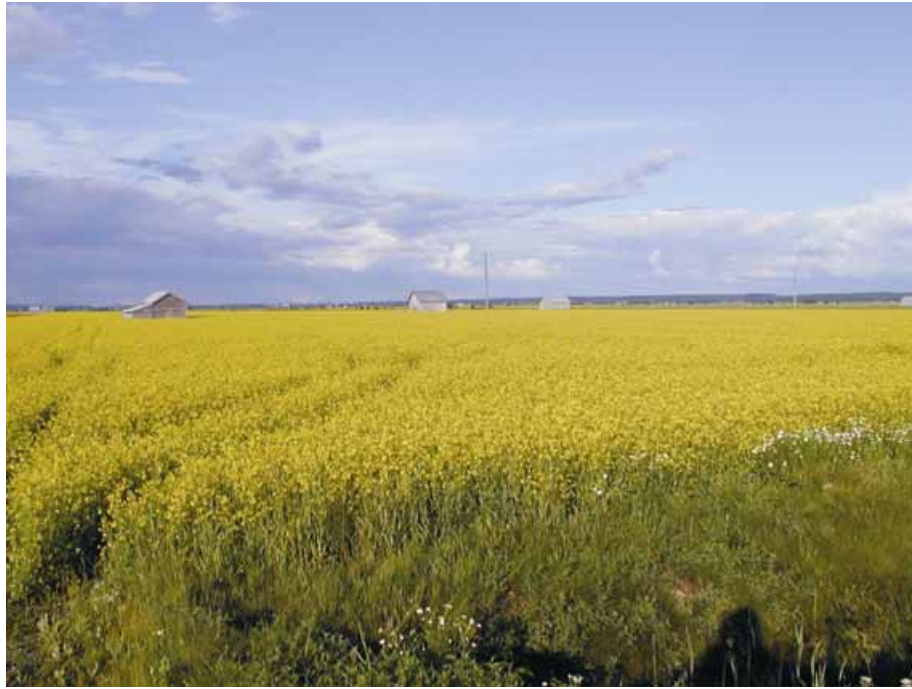
Kuva 5. Söderfjärdenin vaikuttavalla viljelylakeudella on edelleen muutamia latoja ja riisiä.

määräyksiä maiseman- ja luonnon huomioimisesta hakkuiden yhteydessä (MU).