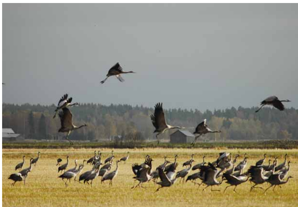
Kuva 4. Muuttavia kurkia Söderfjärdenillä.

Söderfjärdenillä oleskelevien kurkien määrä houkuttelee syksyisin myös ihmisiä. Paikalliset lintutieteelliset yhdistykset järjestävät keväisin ja syksyisin retkiä Söderfjärdenille. Viljelyaukealla ja etenkin pumppausasemalla ja näkötorussa käy kesäisin sekä yksittäisiä kävijöitä että opastettuja ryhmiä. Kävijämäärä aiheuttaa etenkin keväisin ja syksyisin ongelmia työkoneiden eteen pysäköityjen autojen muodossa. Söderfjärdenin keskelle Marenintien varteen Sundomin jakokunnan omistamalle alueelle on siksi tehty pieni parkkipaikka. Sundomin kyläyhdistys (bygdeförning) tulee siirtämään alueelle vanhan riihen, johon perustetaan Söderfjärdenistä kertova näyttely, tähtitieteellinen observatorio sekä kahvila. Läheisyyteen rakennetaan myös uusi lintutorni.