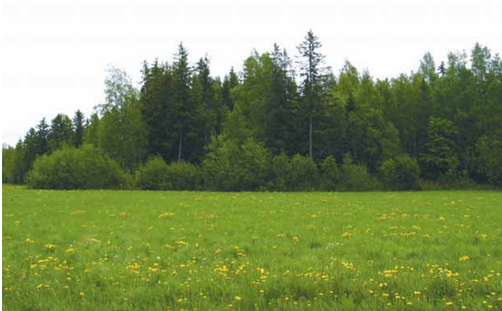
Kuva 10. Monimuotoisen metsänreunan luomiseen ja säilyttämiseen voi saada maatalouden ympäristötukea. (kuva: Carina Järvinen)

Maisema-aluehankkeen puitteissa yritettiin alueen metsille aloittaa niin kutsuttu luonnonhoitohanke , jossa maiseman huomioonottavia metsätaloussuunnitelmia olisi laadittu ilmaiseksi kaikille hankkeeseen osallistuville metsänomistajille. Tällä hetkellä hankkeelle ei kuitenkaan löytynyt tarpeeksi kiinnostusta, mutta luonnonhoitohankkeen toteuttamisen mahdollisuus on edelleen voimassa, ja mikäli kiinnostusta löytyy tulevaisuudessa, metsänomistaja voi ottaa yhteyttä metsäkeskukseen (taulukko 1). Luonnonhoitohankkeet voivat olla erilaisia, mutta ne kaikki koskevat metsien luonnon- ja maisemanhoidon edistämistä. Näiden hankkeiden kautta yksittäiset metsänomistajat eivät voi saada rahallista tukea, vaan tuki muodostuu työn suorittamisesta, suunnitelmien laatimisesta sekä neuvonnasta. Hankkeiden puitteis-