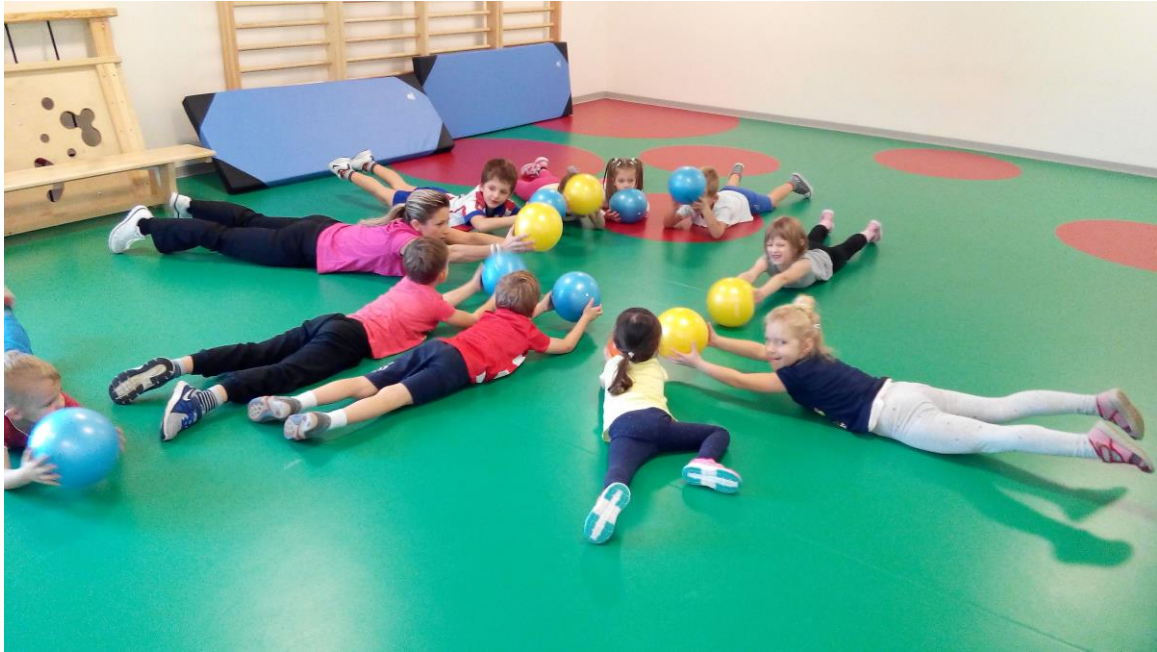
Slika 15. Vježbe s loptom