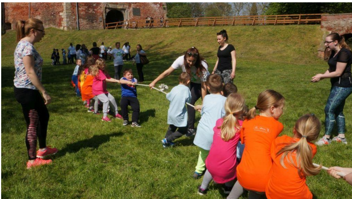
Slika 9. Dječja igra potezanja konopa

Lorger i Prskalo (2010) govore da bi motoričke igre djece predškolske dobi trebale svojim sadržajem poticati razvoj osnovnih motoričkih sposobnosti djeteta, a njihov cilj bi trebao biti usmjerenje na poticanje brzine, koordinacije, skočnosti, fleksibilnosti i jakosti djece. Sadržaje tih motoričkih igara trebalo bi „vezati“ uz elemente različitih sportskih igara (nogomet, rukomet, košarka...) koje su popularne kod djece i primjerene njihovoj dobi. Struktura takvih gibanja treba biti primjerena predškolskoj dobi djece kako bi se naglasila njihova uloga u razvoju motorike ruku i nogu, odnosno koordinacije u pokretu s različitim pomagalima tijekom igre. Sami sadržaji motoričkih igara trebaju biti različiti i potencirati različita motorička iskustva djece. Atmosfera u svim igrama treba biti motivirajuća, živa i ugodna djeci kako bi ih uz motoričke igre „vezala“ ugodna i poticajna sjećanja. Zadovoljstvo i uživanje djeteta su prioriteti svake motoričke igre, a slijeđenje pravila i pravilno ovladavanje tehnikom dolaze tek kao sekundarna važnost.