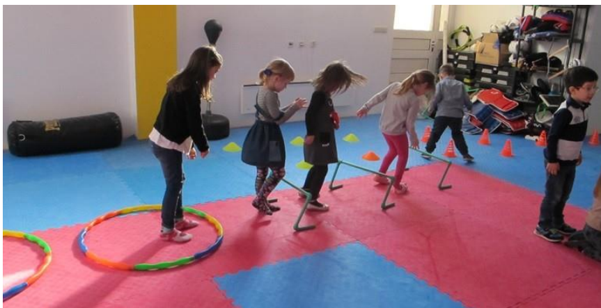
Slika 16. Vježbe ravnoteže i koordinacije

Kako djetetovo tijelo sazrijeva, evolucija motoričkih vještina ovisi o sve više efikasnim načinima procesuiranja informacija. Ukratko, kako bi motorički razvoj napredovao, kognitivni razvoj mora napredovati sukladno s njim pa tako dijete iz jednostavnijih motoričkih zadataka uči i usavršava stvari potrebne za izvršavanje kompleksnijih akcija. Četiri osnovna motorička kapaciteta koji reflektiraju djetetovu atletsku vještinu su prethodno navedene ravnoteža, fleksibilnost, brzina i snaga. Usavršavanje svakog od ta četiri kapaciteta zahtjeva određenu mentalnu snagu i napor.