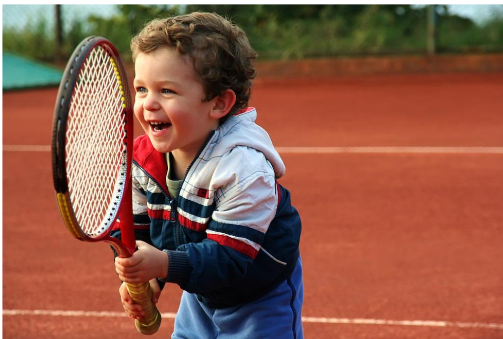
Slika 4. Individualni sport u ranoj dobi

Djeca predškolske dobi posebno su osjetljiva na vanjske podražaje okoline i njezin motivacijski ili demotivacijski učinak na djetetovo unutarnje stanje. Prema Sindik (2008) preuranjeno i silovito ulaženje u svijet sporta za dijete može biti traumatizirajuće iskustvo i vrlo brzo prouzročiti negativni efekt pa tako dijete s kojim se neprimjereno postupa ili se od njega očekuje previše za njegovu dob može vršiti veliki otpor prema fizičkoj aktivnosti tijekom cijelog života nakon takvog iskustva. Kako bi se dijete pravilno poticalo u ostvarenju njegovih tjelesnih, socijalnih i mentalnih potreba i želja važno je unaprijed znati pojedine elemente koji sačinjavaju cjelokupnu sliku djeteta. Bez poznavanja psihofizičkih osobina djeteta, ne možemo procijeniti koji sport i u kojoj mjeri je primjeren kojem djetetu a isto tako ne možemo očekivati vrhunske rezultate od djeteta koje razvojno još nije primjereno tim zadacima.