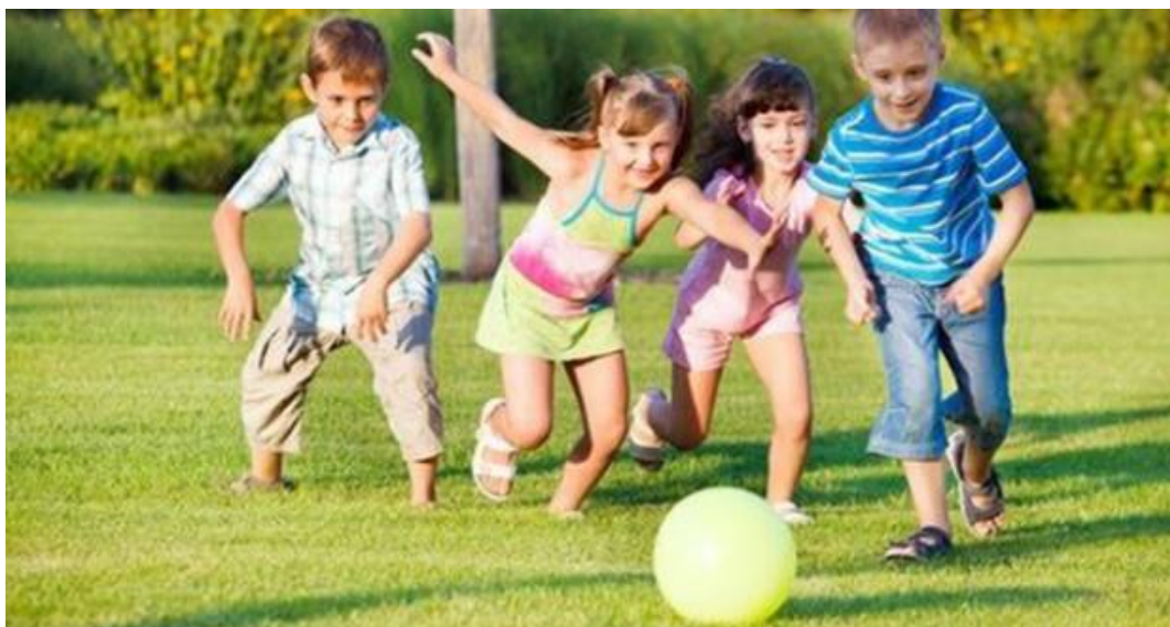
Slika 14. Igra s loptom na otvorenom