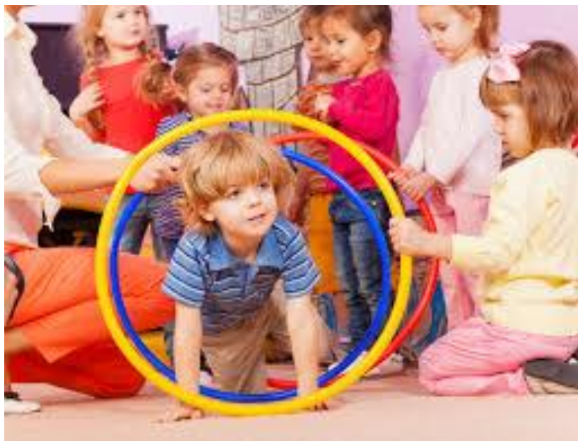
Slika 1. Provlačenje kroz obruč

djeteta sa sportom i svim faktorima koje on donosi sa sobom, uključujući razvijanje motoričkih i kognitivnih sposobnosti te emocionalnih i socijalnih osobina. Upoznavanje djeteta sa sportom treba biti u skladu s djetetovim razvojem, pa u skladu s time osoba zadužena za to, mora imati prethodna znanja i vještine te odabrane načine kako će djetetu pristupiti i kako će sport predstaviti prvenstveno kao izvor zabave i užitka. Krajnji cilj sporta svakako treba biti poboljšanje motoričkih i funkcionalnih sposobnosti djeteta, ali i emocionalnih i socijalnih osobina budući da one čine važnu sastavnicu u životu svakog pojedinca.