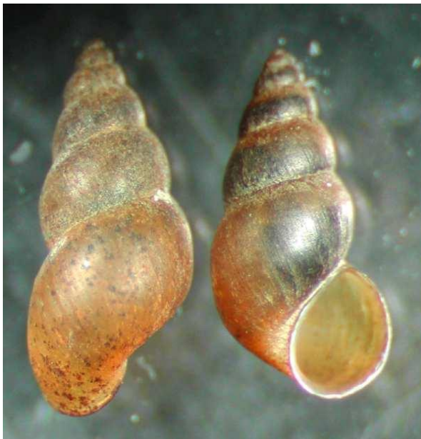
Slika 1. Vrsta Potamopyrgus antipodarum (Snimio D. L. Gustafson)

Otvor na kućici jajolikog je oblika. Otvor zatvara operkulum. To je rožnata tvorevina koja je ponekad građena od kalcijeva karbonata i konhiolina, zatvara ušće kućice kada se glava i stopalo uvuku. Veličina invazivnih puževa uglavnom iznosi 4-6 mm dok u Novom Zelandu gdje su autohtona vrsta mogu narasti do 12 mm (Zaranko et al., 1997; Levri et al., 2007). Pod mikroskopom slabog povećanja tkivo embrija je blijedožučkaste boje za razliku od tamnijeg tkiva roditelja.