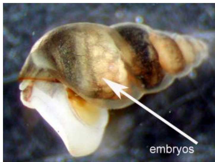
Slika 3. Embriji u ženki

Životni vijek mu je oko dvije godine. U Novom Zelandu, koji mu je izvorno stanište, reproducira se spolno i nesporno, spolni oblici su diploidni (sadrže dva seta kromosoma, 2n ) i postoji manje od 5 % mužjaka sposobnih za razmnožavanje. Za razliku od toga, u staništu koje im nije izvorno prevladavaju ženke koje se nesporno razmnožavaju partenogenezom. To je oblik razmnožavanja u kojem se jaje razvije u mladu životinju bez oplodnje. Nastaju mladi koji su genetički istovjetni roditeljima. Kod životinja odvojenih spolova mladi koji nastaju ovim oblikom razmnožavanja uvijek su ženke ( http://rivrlab.msi.ucsb.edu ). Populacije nastale partenogenezom isključivo su triploidne (sadrže tri seta kromosoma, 3n ), (Alonso & Castro-Diaz, 2008). Ženke koje se razmnožavaju partenogenezom mogu proizvesti dva puta više potomaka nego ženke koje se razmnožavaju spolno. Ženke koje se razmnožavaju spolno daju potomke obaju spolova.