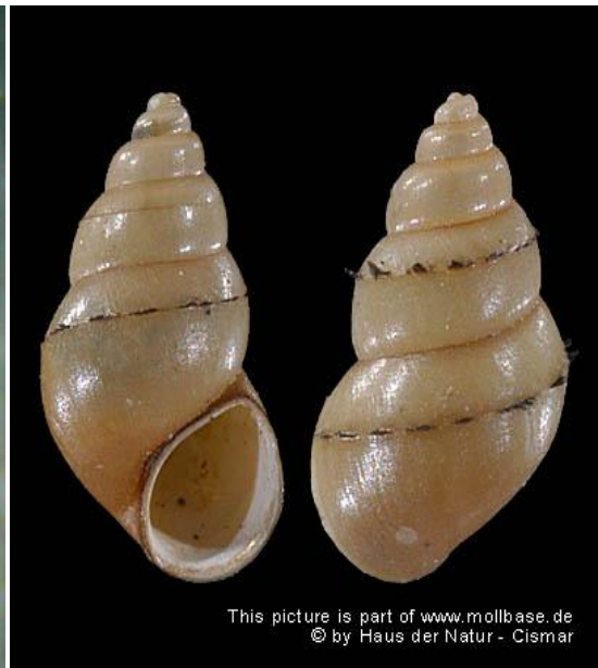
Slika 2. Kućica s bodljama ( http://www.mollbase.de/list/index.php?aktion=zeige_taxon&id=75 )

( http://www.issg.org/database/image.asp?ii=534&ic=e )