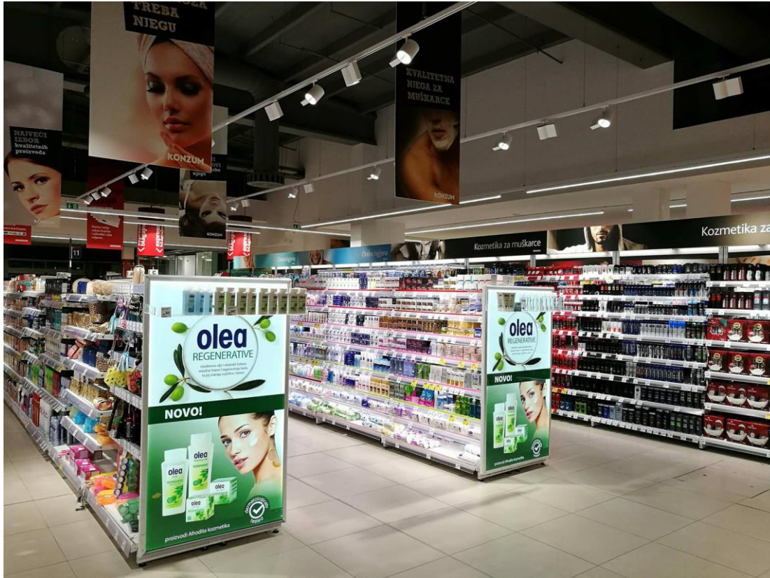
Slika 6. Odjel kozmetičkih proizvoda i proizvoda za njegu

Veliku pažnju privlači odjel drogerije koji je osvijetljen potpuno drugačije od svih odjela.