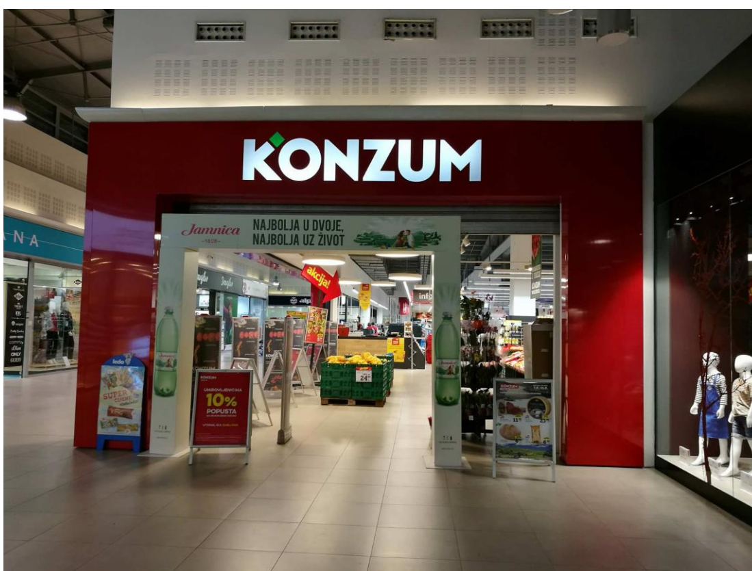
Slika 1. Ulaz u trgovinu Konzum

Trgovine unutar trgovačkog centra imaju staklene izloge što čini prostor otvorenijim i pristupačnijim.