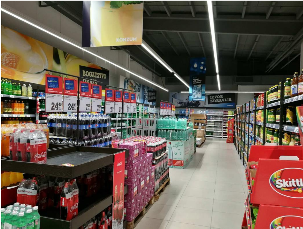
Slika 5. Odjel bezalkoholnog i alkoholnog pića

Zapažena je razlika između polica u odjelu pića i ostalih odjela. Odjel pića ostavlja dojam boravka u skladištu, a posebno u odjelu bezalkoholnog pića.