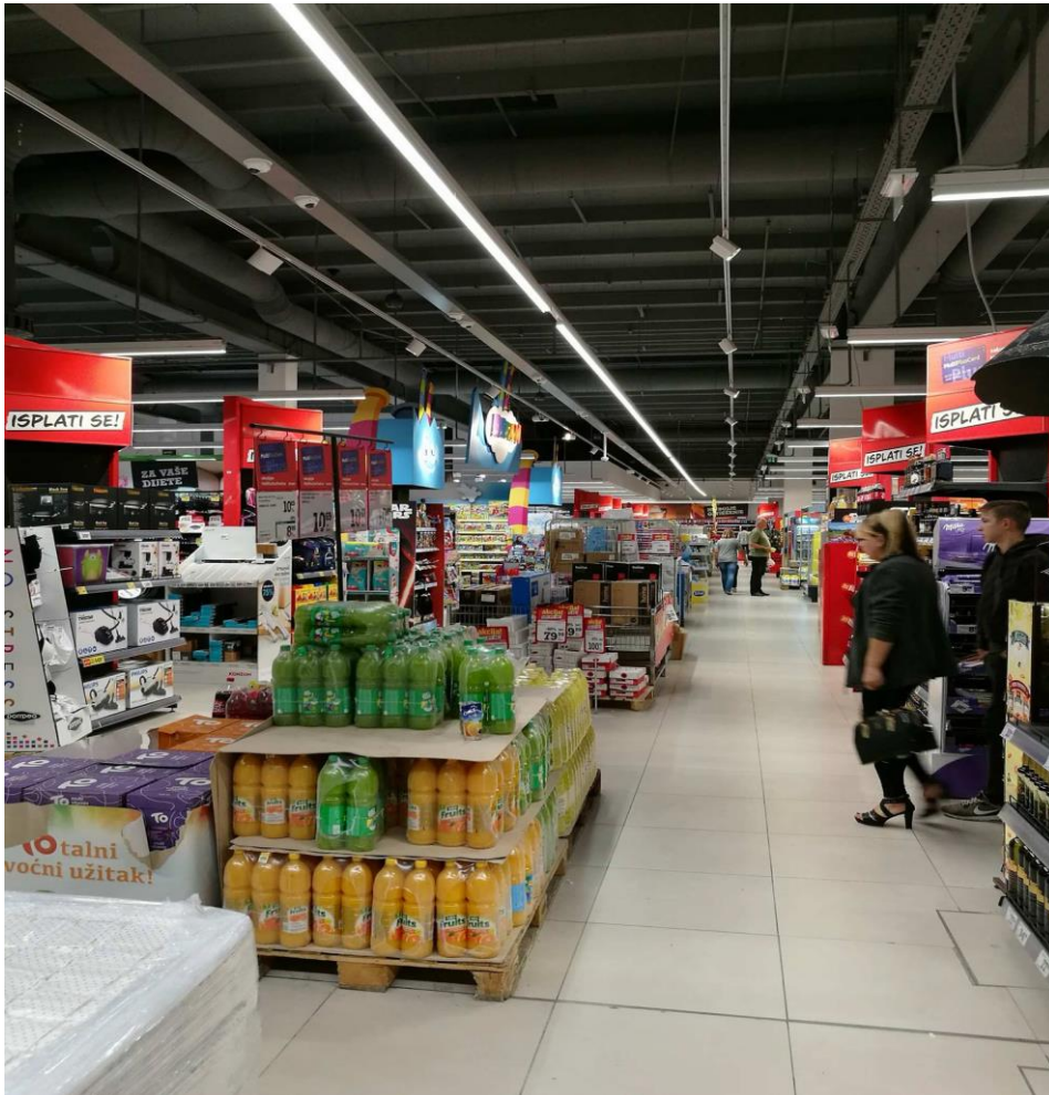
Slika 3. Proizvodi na akciji u središtu Konzuma

Akcijski proizvodi su postavljeni usporedno s policama odmah blizu ulaza u trgovinu.