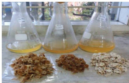
Gambar 4. Foto Hasil Ekstraksi Gelatin