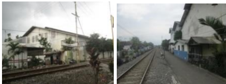
Gambar 13. Industri pada Kawasan Sempadan Rel Kereta Api

Industri yang ada di kawasan Sempadan Rel Kereta Api ini merupakan perusahaan-perusahaan besar yang sudah cukup lama. Pada awalnya kelurahan Ciptomlyo merupakan kelurahan yang sebagian besar peruntukan lahan untuk bidang industri. Terbukti sekitar tahun 1970 masih ditemukan Rel Kereta yang melewati beberapa perusahaan yang ada.