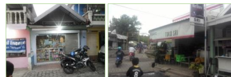
Gambar 3. Toko pada Kawasan Sempadan Rel Kereta Api