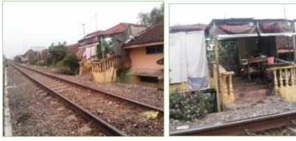
Gambar 4. Kios pada Kawasan Sempadan Rel Kereta Api