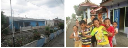
Gambar 11. Balai RW pada Kawasan Sempadan Rel Kereta Api

Fasilitas perkantoran yang melanggar garis Sempadan Rel Kereta Api di Kelurahan Ciptomlyo berupa balai Rukun Warga (RW) yang berjumlah tiga (3) unit.