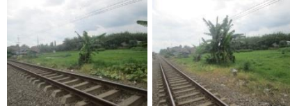
Gambar 14. Lahan Pertanian pada Kawasan Sempadan Rel Kereta Api

dari lahan pertanian yang ada sekitar tahun 1960. Sebagian besar lahan pertanian bergeser menjadi bangunan (tempat tinggal, perdagangan dan jasa, fasilitas umum) serta beralih fungsi menjadi industri.