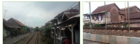
Gambar 2. Rumah pada Kawasan Sempadan Rel Kereta Api