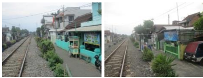
Gambar 5. Warung Makan pada Kawasan Sempadan Rel Kereta Api

Warung makan yang melanggar garis kawasan sempadan Rel Kereta Api ini merupakan salah satu jenis usaha yang menyediakan satu jenis makanan.