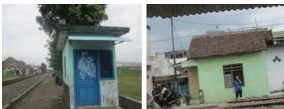
Gambar 12. Pos Kamling pada Kawasan Sempadan Rel Kereta Api

Pos kamling atau Pos Keamanan Lingkungan melanggar garis Sempadan Rel Kereta Api merupakan sarana pelayanan umum yang dibangun secara swadaya oleh masyarakat yang ada.