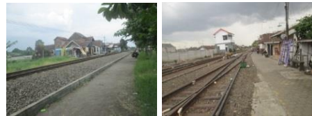
Gambar 15. Jalan pada Kawasan Sempadan Rel Kereta Api

Jalan merupakan akses bagi masyarakat untuk melaksanakan kegiatan setiap harinya. Fungsi jalan yang ada di kawasan sempadan rel kereta api di Kelurahan Ciptomlyo merupakan jaringan jalan lingkungan dan jalan setapak dengan kondisi, jalan paving dan jalan aspal kasar.