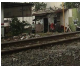
Gambar 7. Salon pada Kawasan Sempadan Rel Kereta Api

Jasa salon yang melanggar garis sempadan rel kereta ini berjumlah tiga (3) unit.