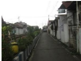
Gambar 6. Loundry pada Kawasan Sempadan Rel Kereta Api

Loundry merupakan jenis usaha pencucian pakaian. Jasa loundry yang melanggar garis sempadan rel peruntukan lahanya menjadi satu dengan tempat tinggal.