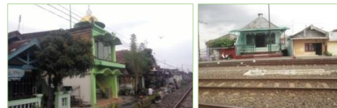
Gambar 9. Masjid pada Kawasan Sempadan Rel Kereta Api

Fasilitas peribadatan yang ada di Sempadan Rel Kereta Api adalah Masjid dan Mushola. Masjid dan mushola merupakan sarana peribadatan bagi umat Islam yang menunjukkan bahwa mayoritas masarakat yang menempati lahan Sempadan Rel Kereta Api ini memeluk agama islam.