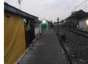
Gambar 8. Pedagang kaki lima pada Kawasan Sempadan Rel Kereta Api

Pedagang kaki lima yang dimaksudkan dalam penelitian ini merupakan pedagang yang menggunakan gerobak ataupun tenda sederhana. Pedagang kaki lima di wilayah sempadan ini mulai aktif antara pukul 15.00 - 21.00 WIB.