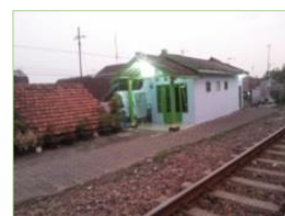
Gambar 10. Puskesmas pada Kawasan Sempadan Rel Kereta Api

Fasilitas kesehatan yang melanggar garis sempadan rel kereta api adalah Puskesmas Pembantu, bidan praktek serta dokter praktek. Fasilitas kesehatan merupakan sarana pelayanan umum yang melayani kesehatan bagi masarakat.