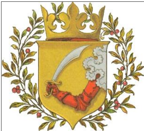
Prilog 2. Grb BiH u vrijeme Austro-Ugarske uprave

Međutim pitanje državno-pravnog uključivanja BiH u postojeću ustavnu strukturu Monarhije ostalo je i dalje otvoreno. Do aneksije BiH je formalno-pravno bila osmanska provincija, mada je stvarna vlast pripadala Austro-Ugarskoj. Iako je nakon aneksije BiH formalno-pravno postala austro-ugarska pokrajina, ona je ipak zadržala specifičan položaj, odnosno nije pripadala ni austrijskom ni ugarskom dijelu Monarhije. Smatrana je krunskom zemljom Habsburgovaca, kojom upravljaju vlade Austrije i Ugarske, kao i od