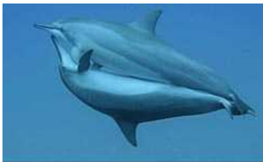
Slika 3. Parenje jednog para dupina ( http://www.sailhawaii.com )

Parenje kitova se kod većine odvija tako da mužjak usklađenim pokretima pliva na leđima, a ženka iznad njega (vidi Slika 3.). Kao kod svih sisavaca, oplodnja je unutarnja i zametak se razvija dijeljenjem zigote. Preko posteljice se zametak prehranjuje i vrši se izmjena plinova. Ženke imaju jedan par sisa smještenih sa svake strane spolnog otvora koje uštrcavaju mlijeko u usnu šupljinu mladog. To je neobično važno jer mladunad nema mekih mišićavih usana kojima bi se mogli vrsto uhvatiti za sisu, pa ju mogu uhvatiti ustima samo na kratko vrijeme. Ženka okoti (vidi Slika 4.) obično jedno mladunče nakon oko godine dana skotnosti (varira među vrstama). Nakon okota ženka se ne tjera tijekom nekoliko prvih mladunčevih godina, te odbijati svaki pokušaj mužjakova snubljenja.