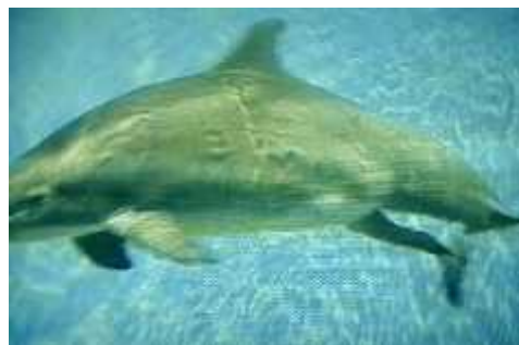
Slika 4. Rađanje dupina ( http://www.rainbowdolphin.com )

Najvažnija majinska zadaća je pronalaženje hrane. Mladunci ovise o majkama oko 3-6 godina, te u tom razdoblju učine samostalno brinuti o sebi ( www.bio.davidson.edu ). Isprva učine isključivo oponašanjem majki. Dupini se razvijaju sa sposobnošću škljocanja i slikih zvukova u službi komunikacije, pa onaj dio eholokacije namijenjen za lakši pronalazak hrane i lakšu egzistenciju te snalaženje u prostoru trebaju tek naučiti. Za to su im potrebni mjeseci. Loviti učine kroz igru. Često se događa da mladunci odlutaju od majke i do 800 metara, što za njih može biti kobno, no i to je važan dio učenja. Smrtnost mladih dupina vrlo je velika.