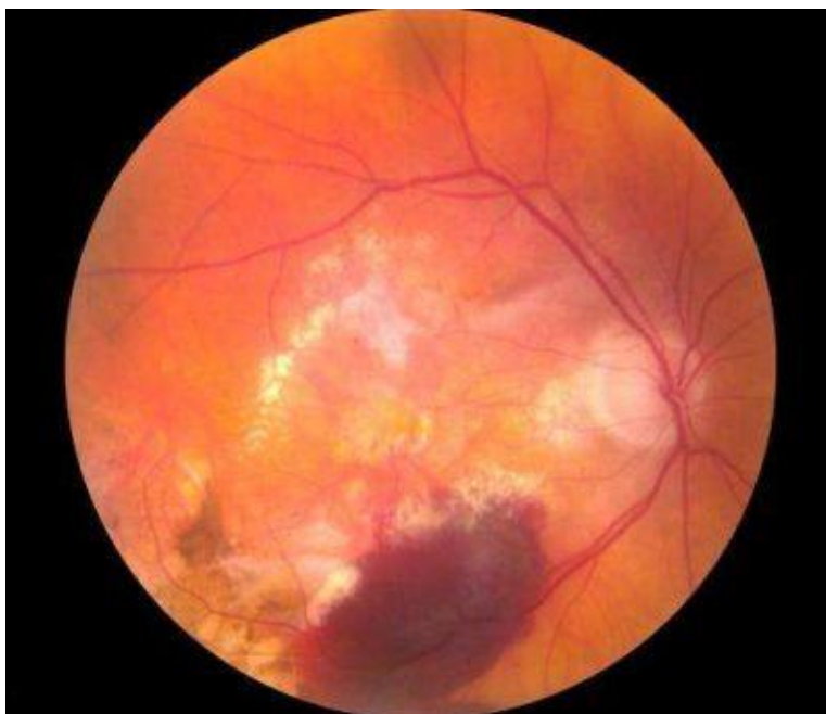
Slika 4. Fundus fotografija: uznapredovala neovaskularna forma AMD-a. Vidljivo je krvarenje iz novonastalih krvnih žila.