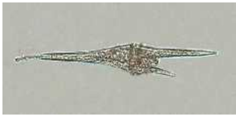
Slika1:Ceratium furca(Ehrenb) Claparede

Dinoflagelati su uz diatomeje najvažniji predstavnici fitoplanktona zbog brojnosti i široke rasprostranjenosti vrsta. Stanicu obavija amfijejma ili teka koja je građena od dvije ili više celulozних ploča. Vrste bez amfijejme imaju periplast i plazmalemu te se zovu atekatne. Kroz celulozne ploče prolaze brojne pore trihocista. Celulozne ploče su glavni element determinacije ovih algi. Dinophyta su miksotrofni i heterotrofni organizmi. Većina migrira na dnevnoj bazi i to vertikalno prema dnu u tamo gdje se hrane sedimentiranim nutrijentima i, prema površini danju gdje fotosintetiziraju. U Rogozni kom jezeru nalazimo pripadnike rodova Scrippsiella , Glenodinium , Gyrodinium , Diplopsalis , te Ceratium (Slika 1) i Prorocentrum (Slika 2) i dr. (Burić i sur., 2009).