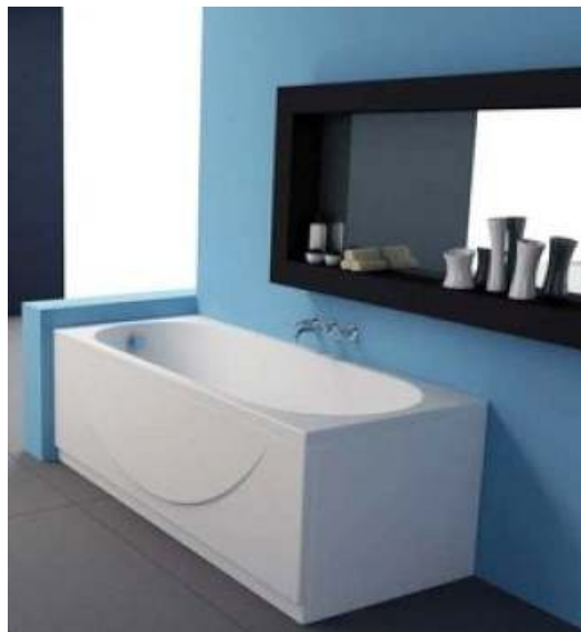
Slika br. 23: kada TAMIA