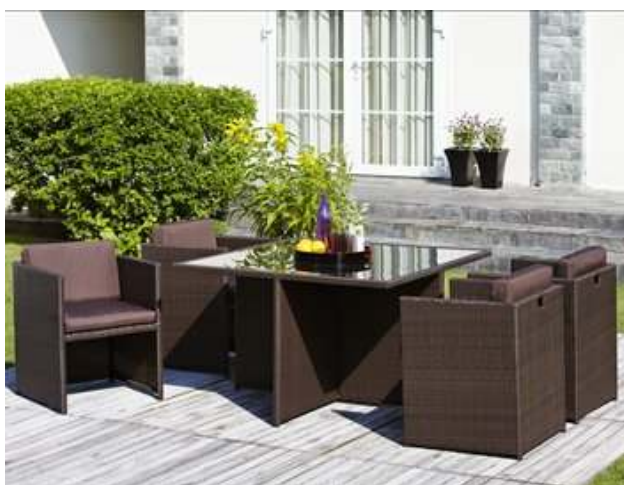
Slika br. 32: Vrtna garnitura ATALANTA

- Vrtna garnitura ATALANTA; materijal: čelik/staklo/pet 34