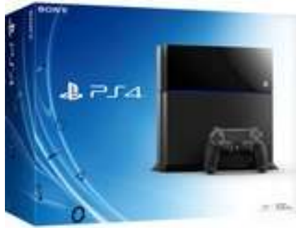
Slika br. 22: igraća konzola PS4