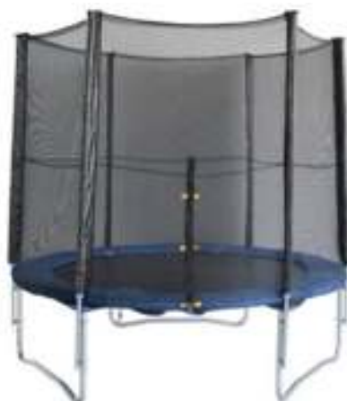
Slika br. 33: trampolin