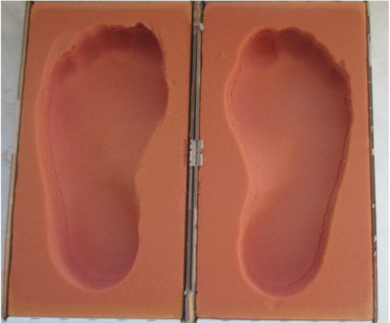
Slika 5: Otisak ljudskog stopala, od kojeg kreće proces izrade uložaka