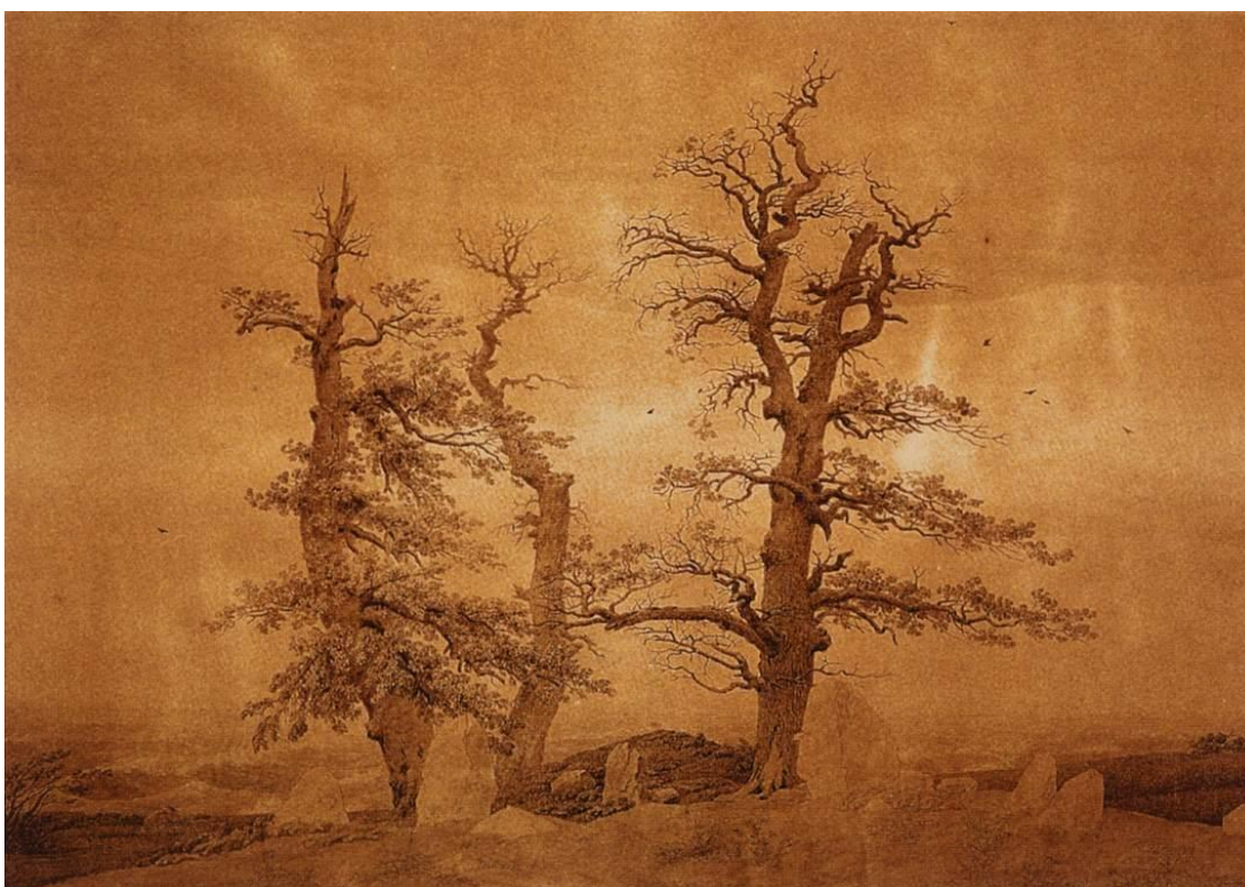
Slika 2 „Veliki grob pored mora“