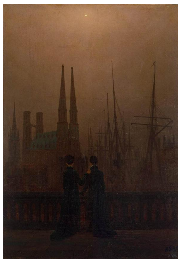
Slika 10 „Sestre na balkonu“