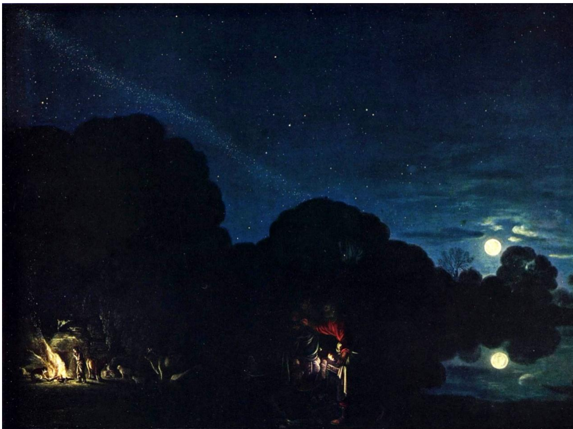
Slika 1 „Bijeg u Egipat“