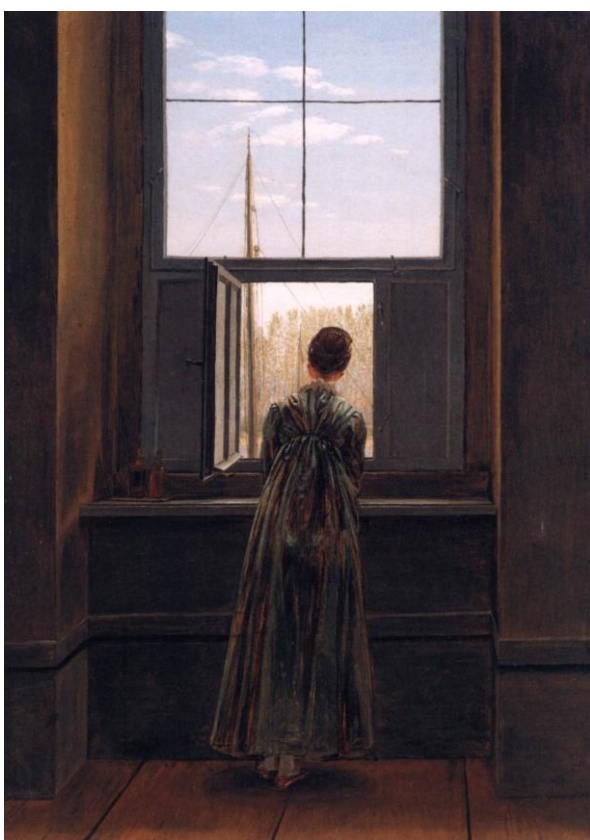
Slika 9 „Žena na prozoru“