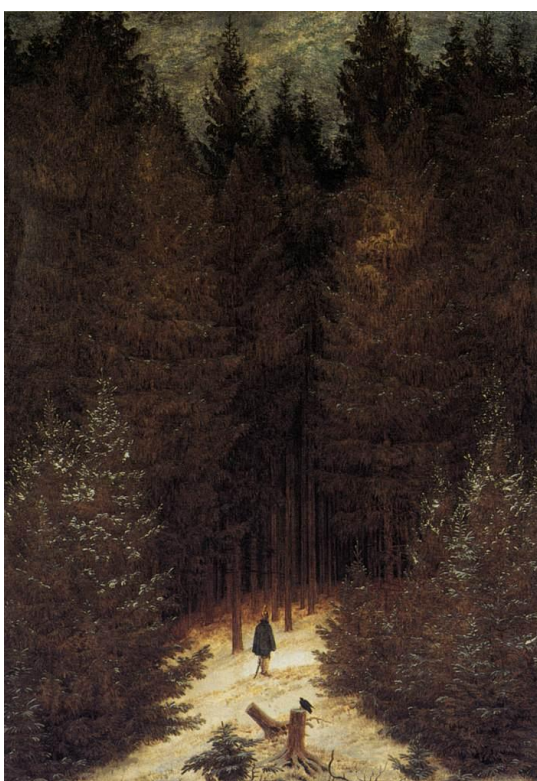
Slika 14 „Lovac u šumi“