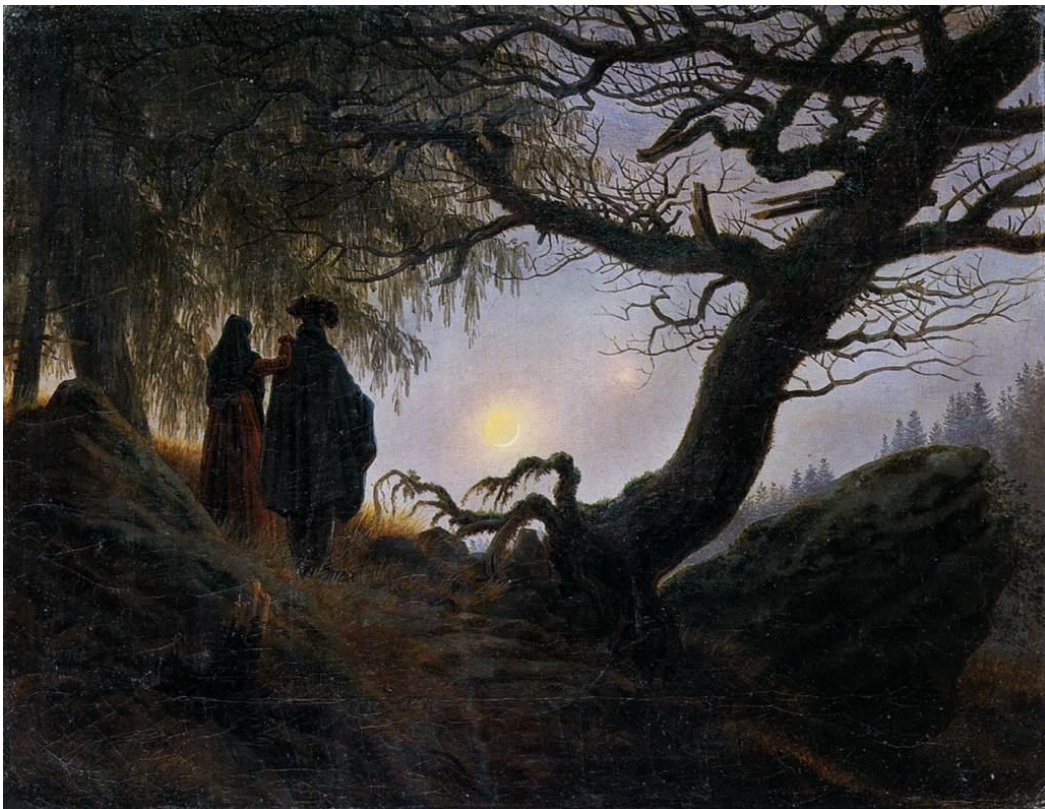
Slika 17 „Muškarac i žena promatraju mjesec“