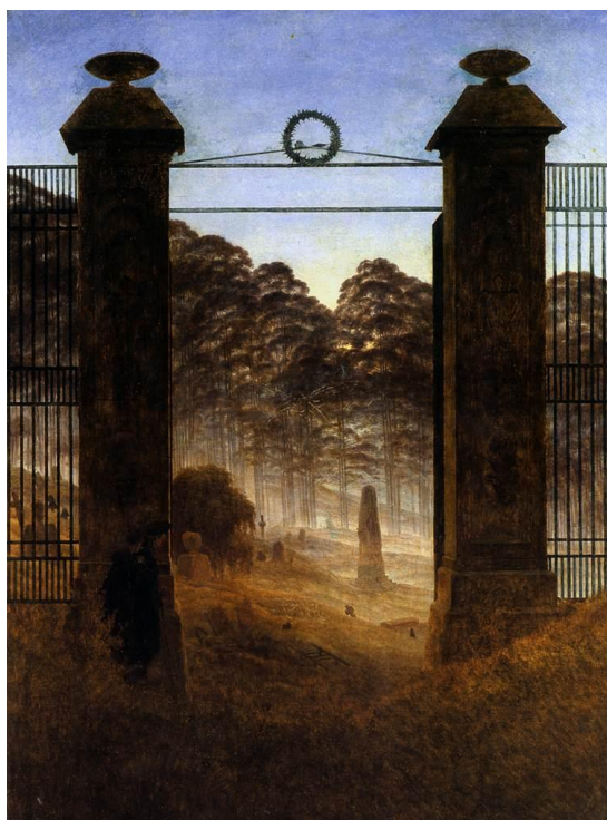
Slika 7 „Ulaz u groblje“