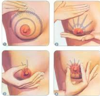
Slika 5. Marmet tehnika ručnog izdavanja

Koristiti obje ruke na objema dojčkama (8).