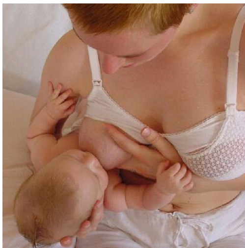
Slika 3. Položaj nogometne lopte - Položaj je pogodan za žene koje su rodile carskim rezom, jer je dijete smješteno bočno i ne pritišće majčin trbuh.