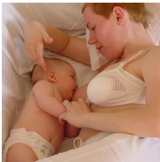
Slika 4. Ležeći položaj - Položaj je pogodan za prve dane dojenja i dojenja tijekom noći.