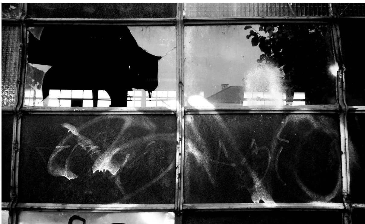
Slika 6. –Uređena fotografija sa pojačanim kontrastima, predložak za print na prozirnicu preko koje je napravljena cijanotipija.