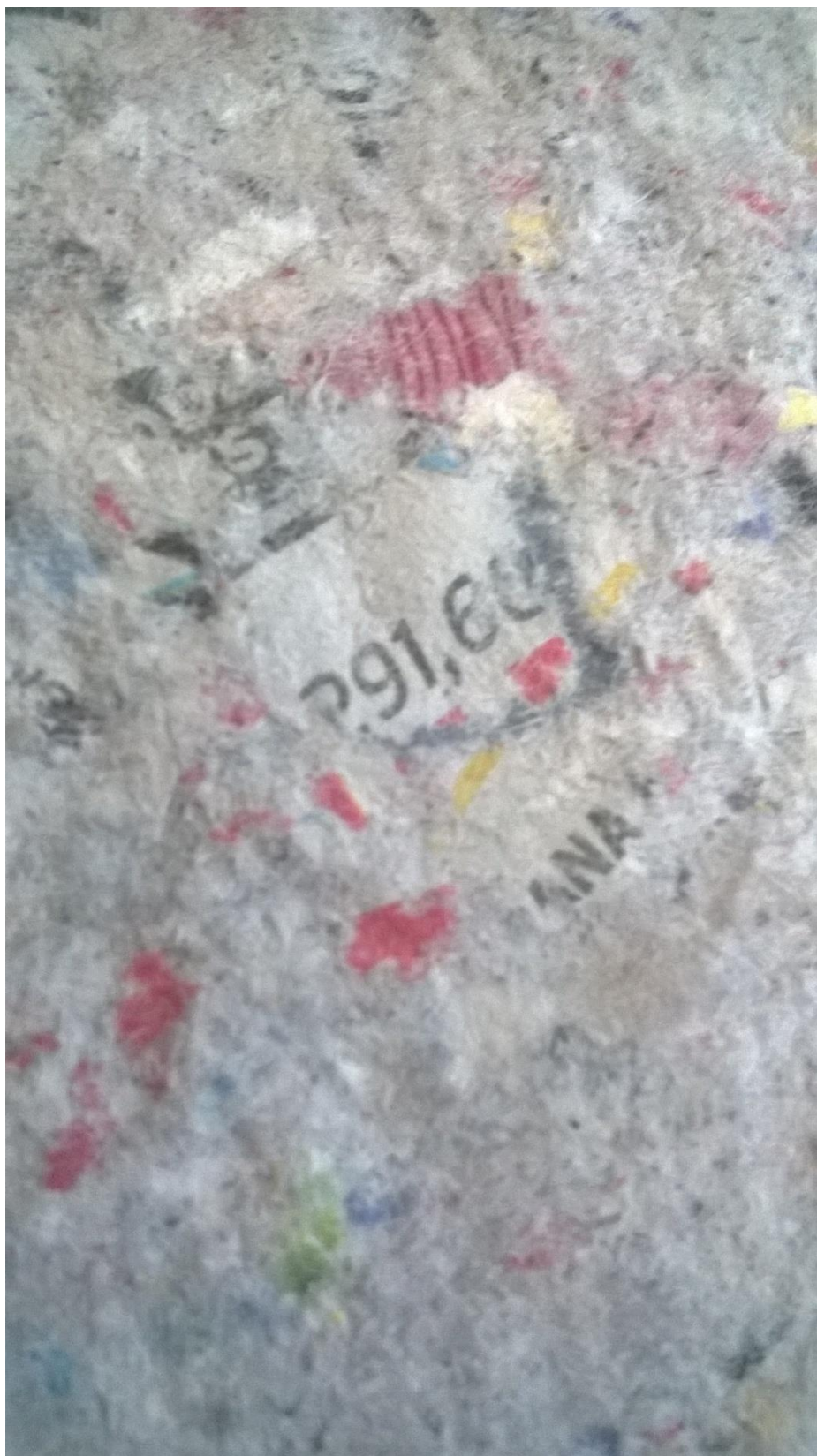
Slika 3. – uvećani prikaz krupnije mljevenog papira. Novinski tisak još je uvijek vidljiv